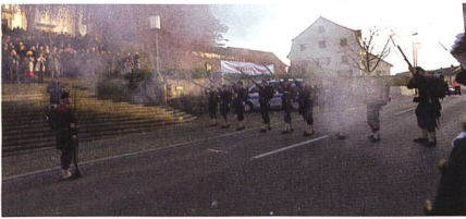
Ehrensalve der Kp 1861 am Ustertag 2021.

Am Ustertag vom 21. November 2021 war der UOV Uster mit der Compagnie 1861, der Artilleriemusik Zürich und dem Militärspiel Uster beteiligt. Unterstützt wurde das offizielle Empfangskomitee traditionell durch die Fahndelelegation der Maritzbatterie des UOV Langenthal und durch die Fahnenwache des Kantonalen Unteroffiziersverbandes Zürich & Schaffhausen. Die Feier erinnert an die Volksversammlung vom 22. November 1830,