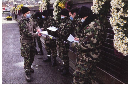
Befehlsausgabe für den Marsch.

hen durch die Stadt Schaffhausen zu verschieben. Dies war nur mittels einem Kanalmarsch, unterirdisch durch Schaffhausen, zu lösen. Vom Ausstiegspunkt beim Güterbahnhof ging es weiter zum Beringer Randenturm, wo die Anwärter diverse Posten betreiben mussten. Die Posten umfassten Zeltbau, Grabenfeuer, Kochen und SNORDA.