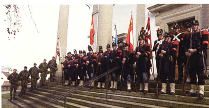
Gruppenbild der Cp 1861 mit der Fahnenwache des KUOV ZH & SH.