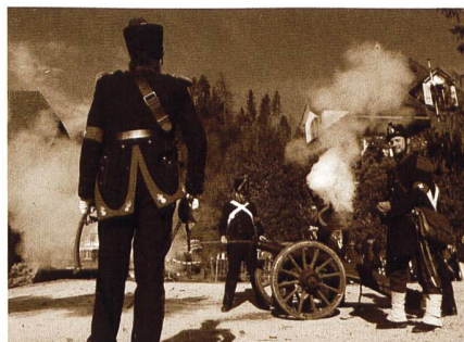
Einsatz der Maritz-Batterie in Signau.

Am 4. Dezember ehren die Artilleristen die heilige Barbara - das Bild, mit welchem der UOV Uster der Schutzpatronin der Artillerie - aber auch der Bergleute und damit eben auch den Infra-HQ-Sol-