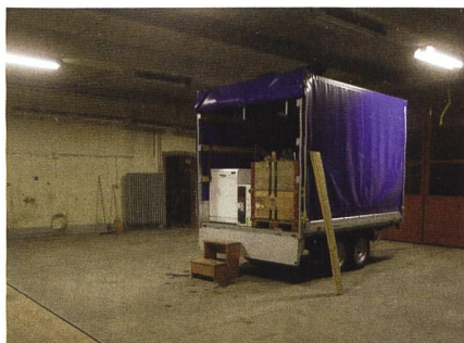
Nun ist auch der letzte Anhänger von Uster nach Bauma transportiert worden.

Jetzt ist es also endgültig Geschichte: das Zeughaus Uster als Homebase für den UOV Uster und die Cp 1861. Am Mittwoch vor dem Barbaratag - also am Mittwoch, 1. Dezember 2021 sind der UOV Uster und die Cp 1861 endgültig in Bauma angekommen. Die Vereinsleitung, aber auch der Kantonalverband wie auch der SUOV bedanken sich beim UOV Uster,