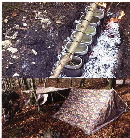
Oben: Kochen mit Grabenfeuer. Unten: Zeltbau.

Nachdem die Postenarbeiten erledigt und alle verpflegt waren, stand noch ein kurzer 6-km-Marsch nach Schaffhausen