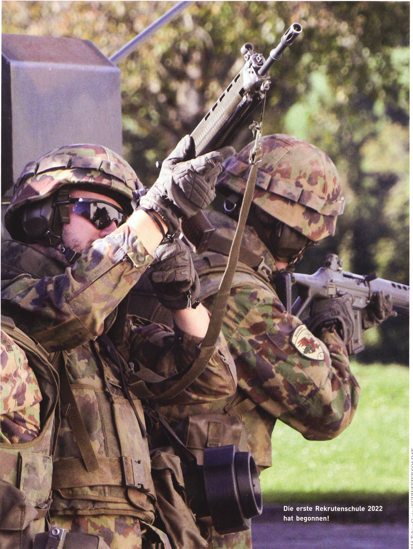
Die erste Rekrutenschule 2022 hat begonnen!