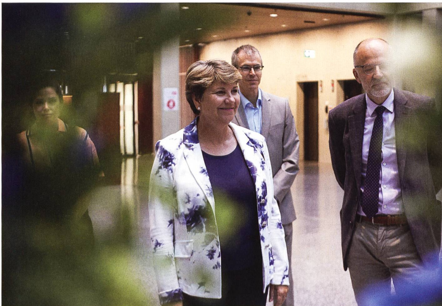
Hinter dem Rücken von Bundesrätin Amherd sollen weitere Departemente ihre eigenen Verhandlungen geführt haben.