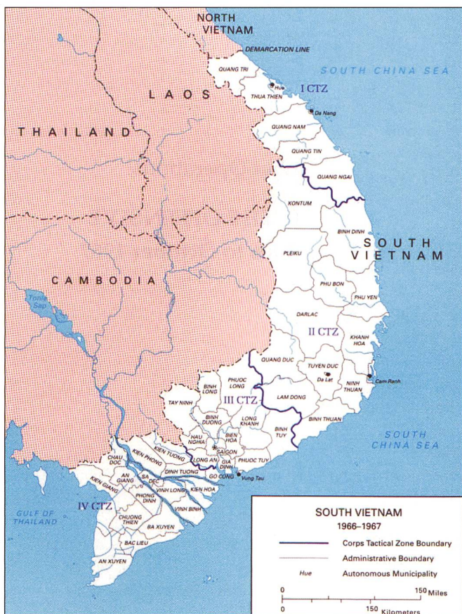
Die vier Militärregionen Südvietnams, im Norden an der DMZ die MR I mit Hue Da Nang und Chua Lai, dann die grosse MR II mit Nha Trang und Cam Ranh, die MR III mit Saigon und die MR IV mit dem Mekongdelta.