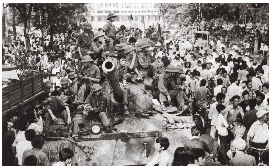
Strassenszene nach dem Fall von Saigon am 30. April 1975.