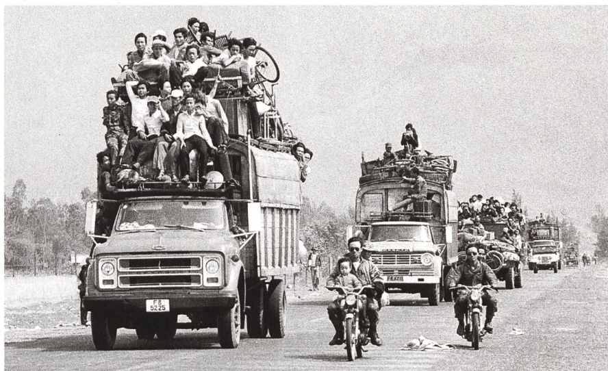
Frühjahr 1975, in Massen flüchten die Bewohner aus der Militärregion I (Region Da Nang) vor den anrückenden Kommunisten südwärts.