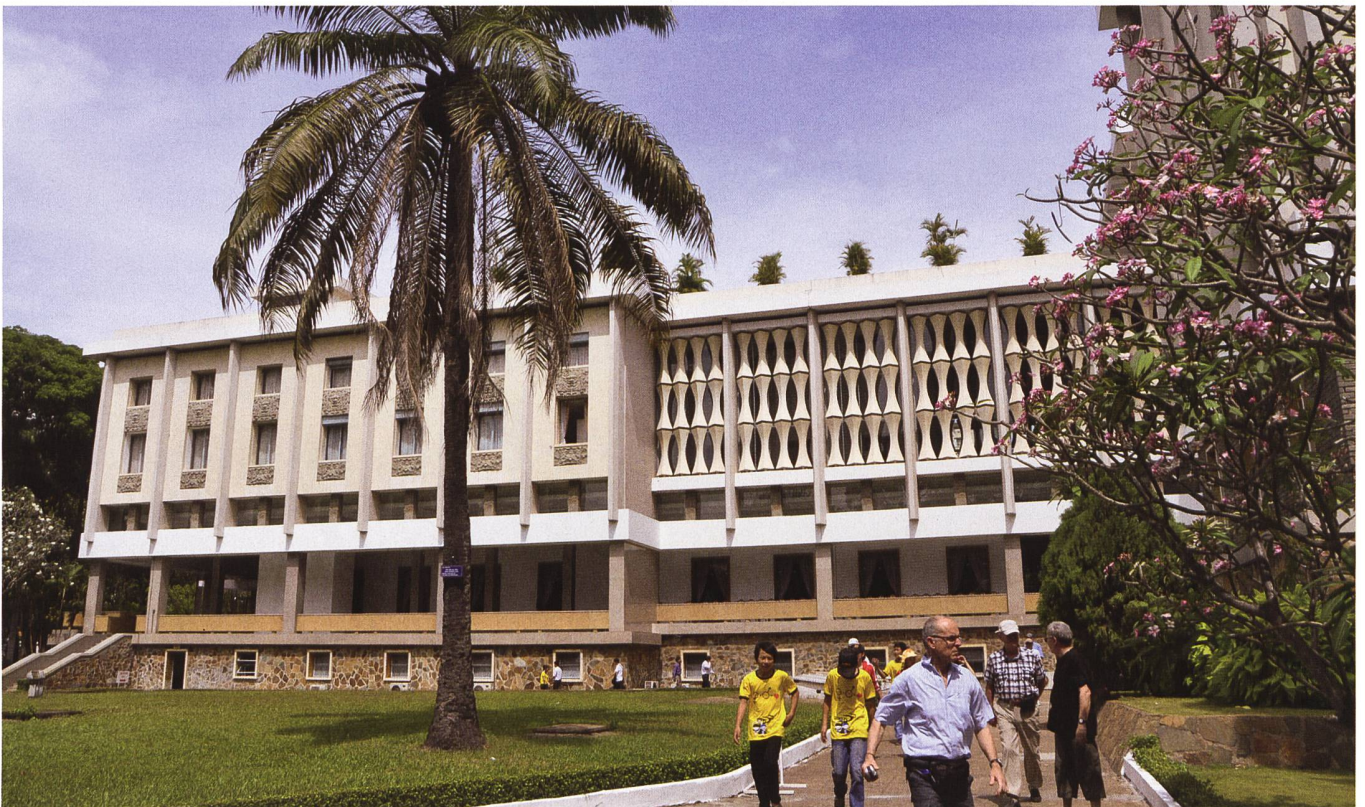
Der Präsidentenpalast in Saigon (heute Ho-Chi-Minh-Stadt), das Symbol des damaligen freien Vietnams, heute heisst er «Wiedervereinigungspalast».

So fehlten von Beginn weg die klaren Zielsetzungen, die die USA mit dem Eingreifen in Vietnam verfolgten, es fehlten die klaren Vorstellungen darüber, was man nach einem Sieg in diesem Land erreichen und zurücklassen wollte und es fehlten vor allem die klaren Vorgaben an die Militärs und die Bereitstellung der erforderlichen Mittel.