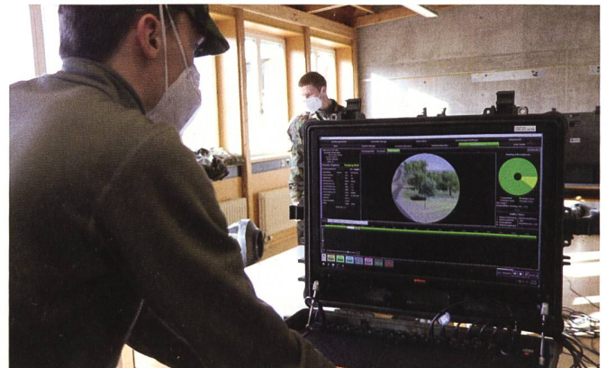
Simulator: Hier ist die Sicht des Schützen zu sehen.