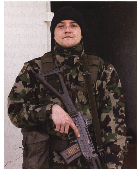
Wachtdienst: Während der Ausbildung wird der Sprengstoff mit scharfer Munition stets bewacht.

Das Beispiel der Infanterie Schule zeigt, dass sich die bisherigen Ausbildungskonzepte der Armee weiterhin bewähren. Das Kader und die Truppe sind sichtlich engagiert und motiviert bei der Sache und zeigen auch einen gewissen Stolz, dass sie diese Funktion ausüben können. Dass dies aber weiterhin möglich ist, ist auch Sache der Bundesverwaltung und der Stimmbürger. Insbesondere im Bereich Ausbildungsinfrastruktur und Unterkunft muss in der Zukunft auch die Infanterieschule 11 berücksichtigt werden. +