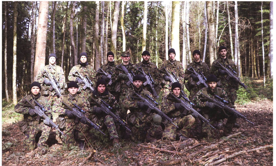
Die Truppführer-Spezialisten mit ihrem Gruppenführer.

Zwei grosse Zelte sind in Betrieb genommen worden. Eines funktioniert als Theorieraum/Speisesaal und das andere ist eine provisorische Turnhalle. Es stellt sich aber die Frage: Die Pandemie ist ja nicht erst gestern ausgebrochen. Warum mietet das Militär hier weiterhin zwei Zelte, anstatt diese zu kaufen? Branchenkenner wissen: Zeltmieten, insbesondere für grosse Zelte gehen ins Geld. Das Kommando Ausbildung sieht das nicht so: «Finanziell ist es fraglich, ob sich ein Kauf