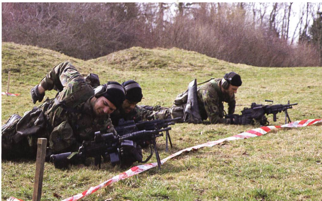
Auf der Drillpiste: Ausbildung am LMg.

Eine Infanterie-Gruppe besteht aus einem Gruppenführer sowie sieben Soldaten. Im Kampf kann sich diese Gruppe noch einmal aufteilen in zwei Trupps. Alpha und Bravo. Der Trupp Alpha wird dabei vom Gruppenführer (Wm) geleitet, während der Soldat mit der Spezialistenfunktion Truppfchef den zweiten Trupp übernimmt. Die Soldaten in der Inf RS mit dieser Spe-