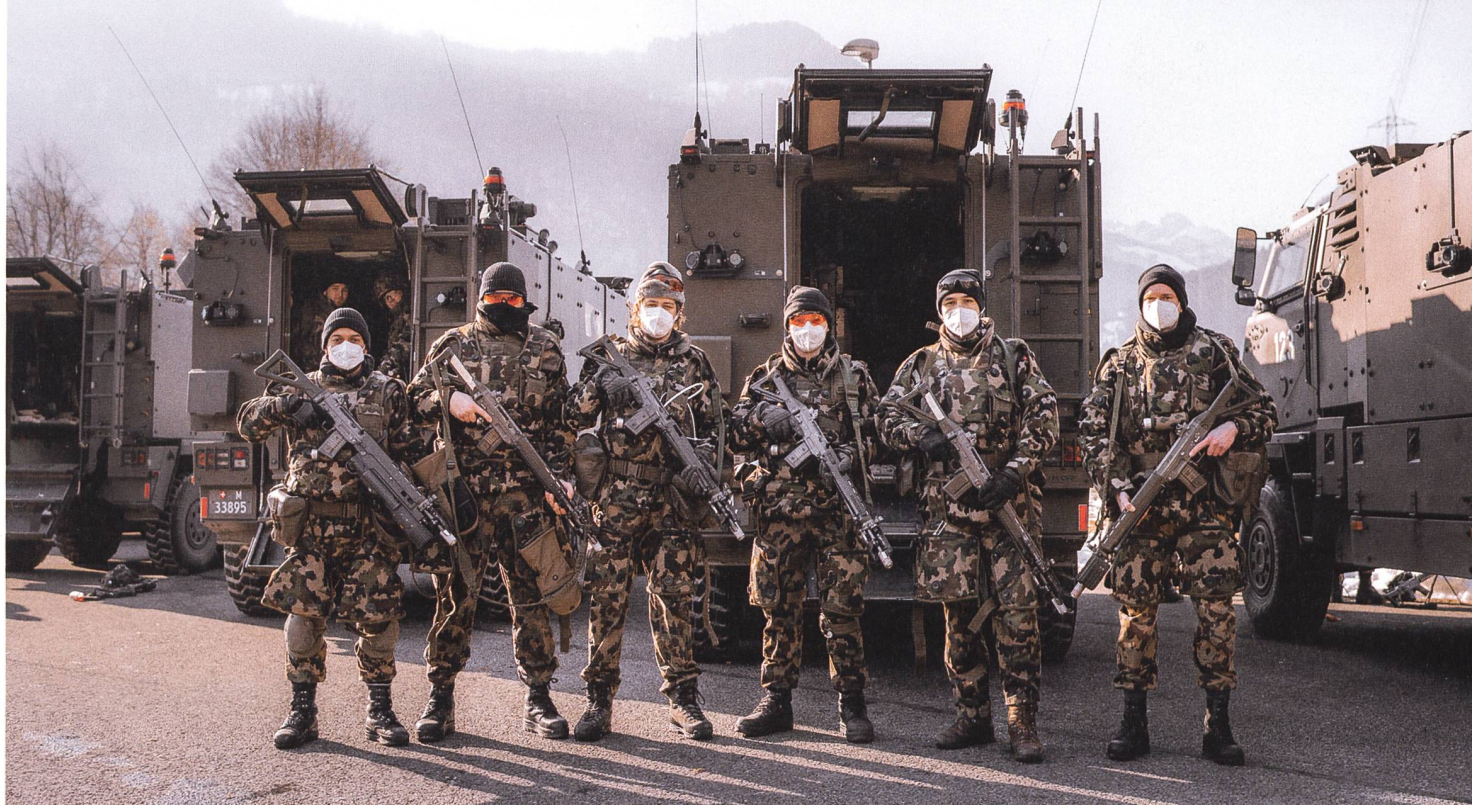
Gelebte Kameradschaft: Das Inf Bat 61 hält auch in schwierigen Zeiten zusammen.

gang ausserhalb der Truppe waren oder die Angehörigen zu Hause besuchten, gab es doch einige Covid-Fälle im Dienst. Das hat dann die Konsequenz, dass dann auch die engsten Kameraden in Isolation gehen müssen – laut Regeln der Armee für sieben Tage.