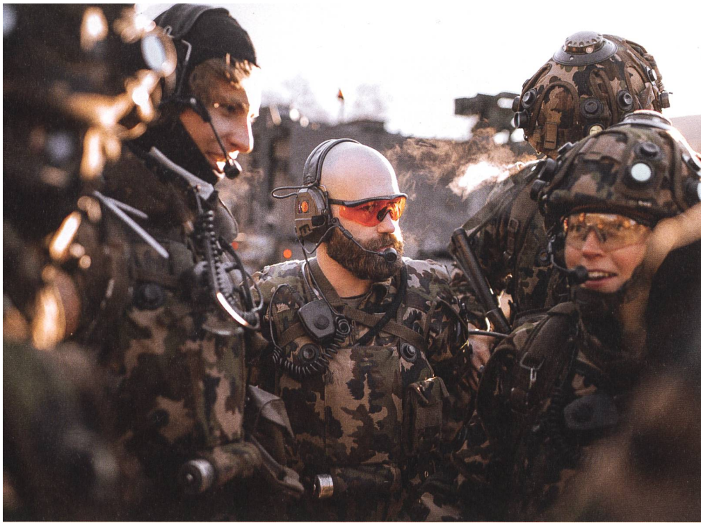
Dieses Jahr konnte das Bataillon seine Fähigkeiten im GAZ OST unter Beweis stellen.