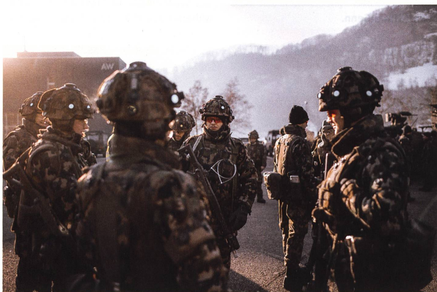
Das Inf Bat 61 absolvierte dieses Jahr seinen WK im Januar 2022 unter schwierigen Bedingungen.