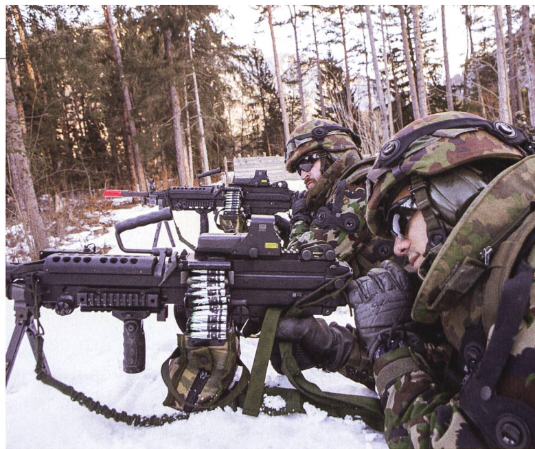
Meine Aufträge halten sich ziemlich kurz: Kämpfen, Schützen, Helfen. Und zwar in dieser Reihenfolge!

77. Mehr zu meiner Geschichte findet ihr übrigens auf meiner Website. Das geht ganz einfach: «Geb Inf Bat 91» in die Suchmaschine eures Vertrauens eingeben.