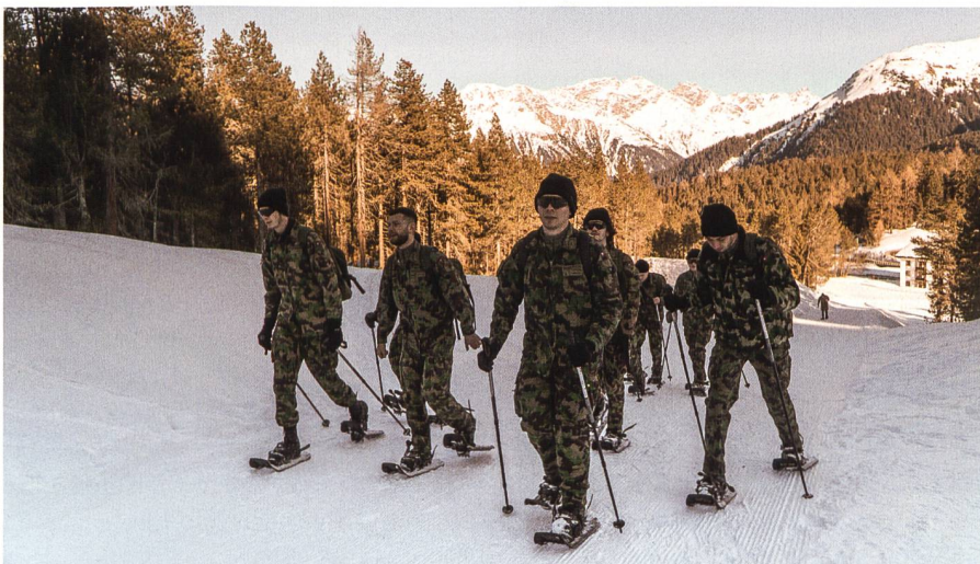
Die Pandemie hat mich so geprägt, dass ich gestärkt als Einheit fungiere. Dies zeigt sich in mehreren Bereichen.

Die Pandemie hat mich so geprägt, dass ich gestärkt als Einheit fungiere. Dies zeigt sich in mehreren Bereichen, so ist der Nachwuchs für jegliche Kaderstellen im Stab bereits frühzeitig gedeckt und viele weitere bekunden bereits Interesse. Auch auf persönlicher Ebene steigerte sich der Zusammenhalt. In den letzten Jahren bildeten sich tiefe Freundschaften, die über den Dienst hinaus Bestand haben. Wir unterstützen uns nicht nur in militärischen Belangen, sondern sind stets für uns und die Schweiz da – treu nach unserem Motto: «Gemeinsam in der Verantwortung, gemeinsam erfolgreich!»