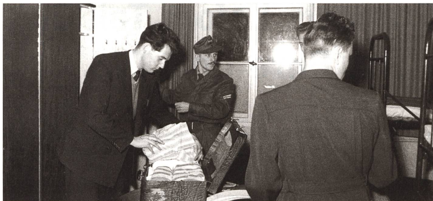
Der Spind wird bezogen. Das neue Konzept lautete nun: «Staatsbürger in Uniform».

Durch die Konzeption der Inneren Führung und dem damit verbundenen Leitbild des Staatsbürgers in Uniform wur-