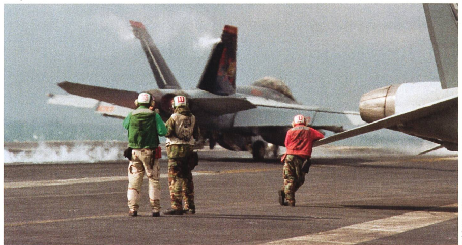
Der US Atomflugzeugträger USS «Harry S. Truman» hat am 1. Dezember 2021 Norfolk verlassen und kreuzt mit seinen Begleitschiffen seither im östlichen Mittelmeer. Kampfflugzeuge des Typs F/A-18 Super Hornet (wie hier eine FA-18F der Fighter Attack Squadron VFA-211 beim Katapultstart) haben im Rahmen des Ukrainekrieges Einsätze bis ins Baltikum geflogen.

An «Cold Response 22» nehmen u.a. der britische Flugzeugträger HMS «Prince of Wales» mit F-35B Kampfflugzeugen, die grossen amphibischen Landungsschiffe HMS «Albion» (UK), FNS «Dixmude» (F) und «Rotterdam» (NL) sowie das Flaggschiff der 6. US Flotte USS «Mount Whitney», Teile der 2. Marinedivision und des 2. Marine Aircraft Wing aus den USA, britische, französische und niederländische Marines sowie weitere Kampfschiffe und Uboote teil.