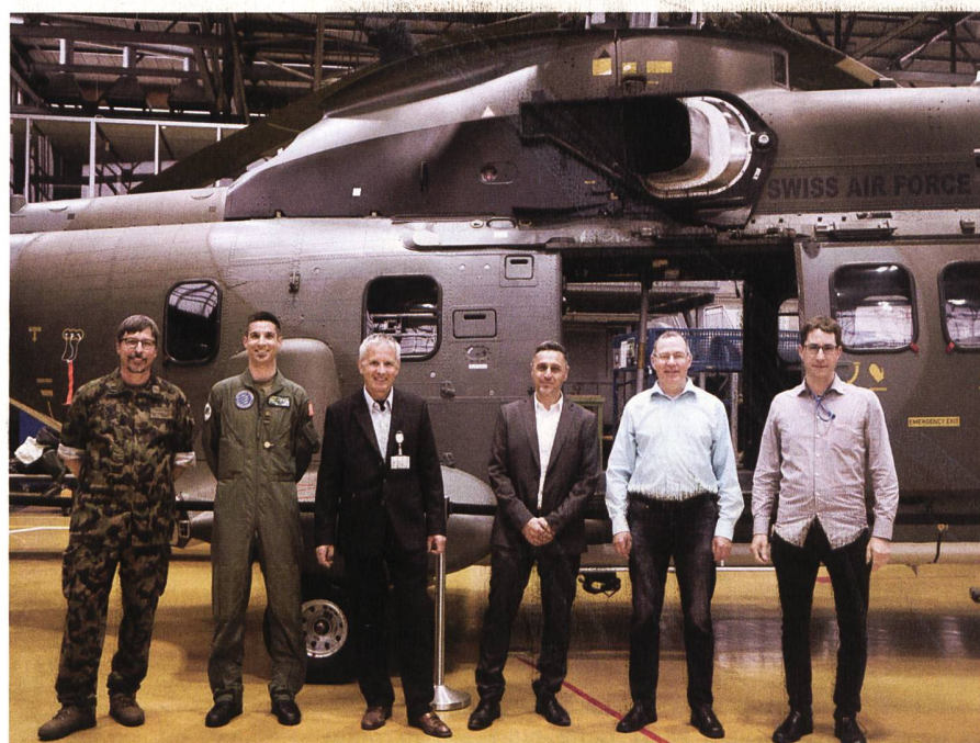
Die Projektverantwortlichen freuen sich über den erfolgreichen Abschluss.