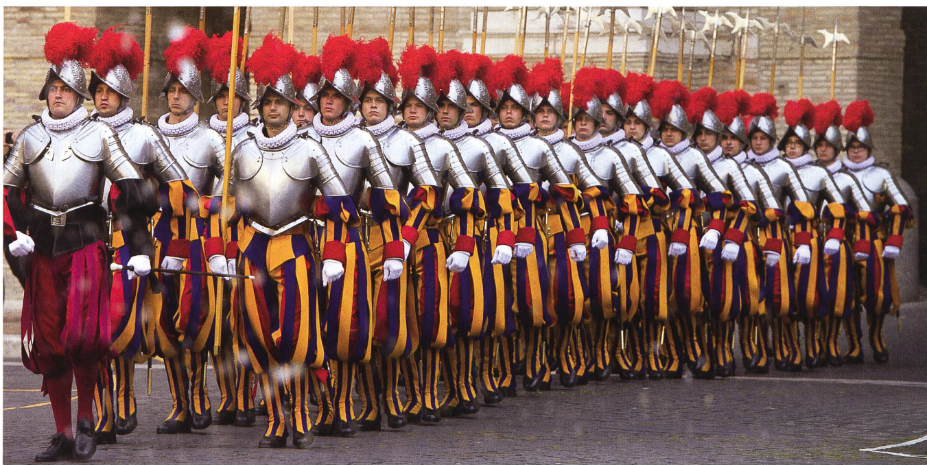
Seit dem Ende des 19. Jahrhunderts ist die Päpstliche Schweizergarde in einer Kaserne untergebracht, die aus drei Gebäuden besteht und an den Apostolischen Palast angebaut ist.

Dieses Projekt, das die Mission unserer Gardisten beim Papst erleichtern soll, ist in der Tat eine starke Verbindung zwischen der Vergangenheit, der Gegenwart und der Zukunft in diesem so besonderen Umfeld des Vatikans, dessen historische, kulturelle, philosophische und ethische Ausstrahlung eine Realität ist, die über die einfache Religionszugehörigkeit hinausgeht. +