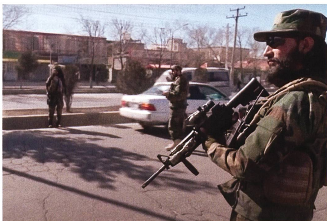
Nach Wochen ohne terroristische Anschläge des IS-Khorasan in Afghanistan gab es vor wenigen Tagen erneut verheerende Anschläge, von denen auch Kinder betroffen waren.

Der IS-Khorasan stellt keine existenzielle Bedrohung für das System der Taliban dar, unter seinen Anschlägen leidet aber die Zivilbevölkerung, vor allem die schiitische Minderheit. Die humanitäre Lage und die Zukunft Afghanistans sind düster. +