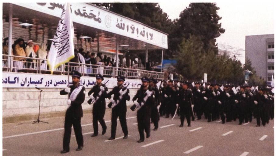
Im Jahr 1996 eroberten die Taliban Kabul und riefen das «Islamische Emirat Afghanistan» aus, im September 2021 taten sie dies ein zweites Mal.

Die afghanischen Soldaten der Afghan National Army und die afghanischen Polizisten der Afghan National Police wa-