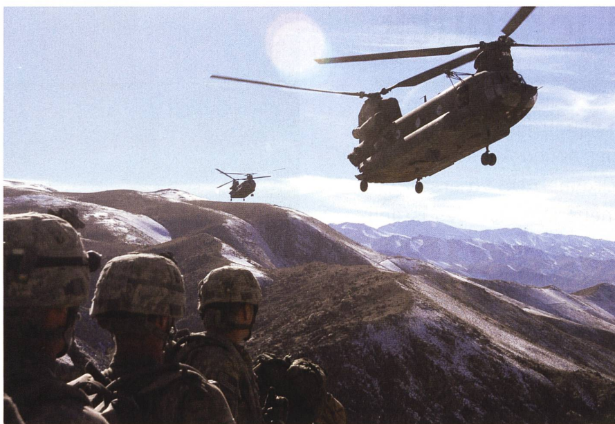
Innerhalb von zehn Tagen brach im August 2021 zusammen, was die westliche Koalition in 20 Jahren aufgebaut hatte

zwölf Menschen getötet und 40 verletzt. Ein weiterer Anschlag wurde in Kabul im überwiegend von Schiiten bewohnten Viertel Dascht-i-Barchi verübt, dabei wurden nach Angaben der Polizei zwei Kinder verletzt.