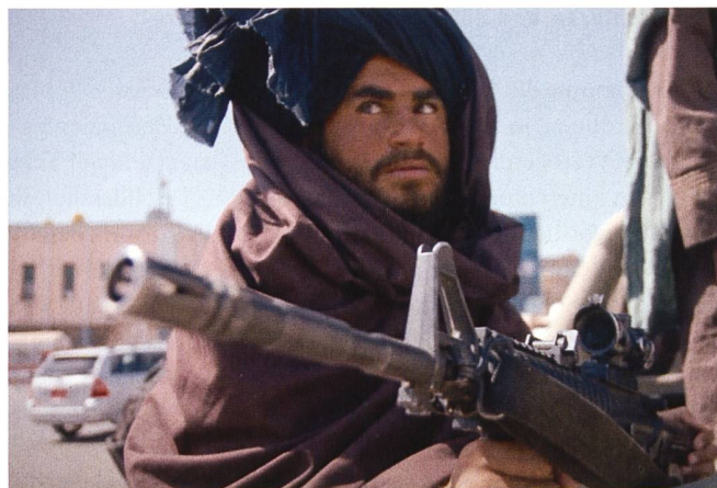
Es sieht so aus, als ob der IS in Afghanistan eine starke Basis etablieren wolle, um von dort aus den Einfluss auf weite Teile Südasiens auszudehnen.