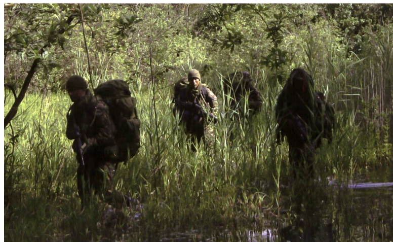
Kern der Spezialkräfte ist die Patrouille.

Bedrohungen durch verdeckt operierende paramilitärische Kräfte potenzieller Gegner-Staaten oder nicht-staatlicher Organisationen machen keinen Halt vor Staatsgrenzen oder «neutral» erklärten Zonen und können jeden Staat betreffen. Gegen diese Bedrohungen haben sich Staaten und ihre Gesellschaften u.a. mit der Aufstellung von Spezialkräften in den Streitkräften und bei den Polizeien abgesichert.