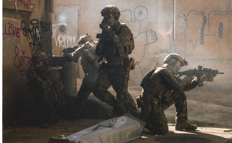
Vorgehen im überbauten Gebiet.