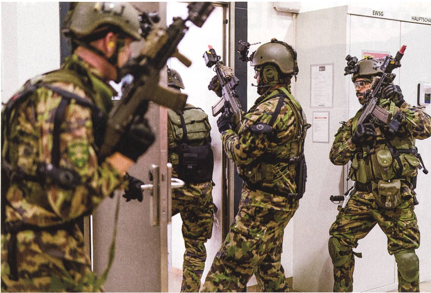
Der Grenadier im Einsatz.

Einsatzelemente aufeinander abzustimmen bestehende Synergien gezielter zu nutzen und Doppelspurigkeiten zu beseitigen.