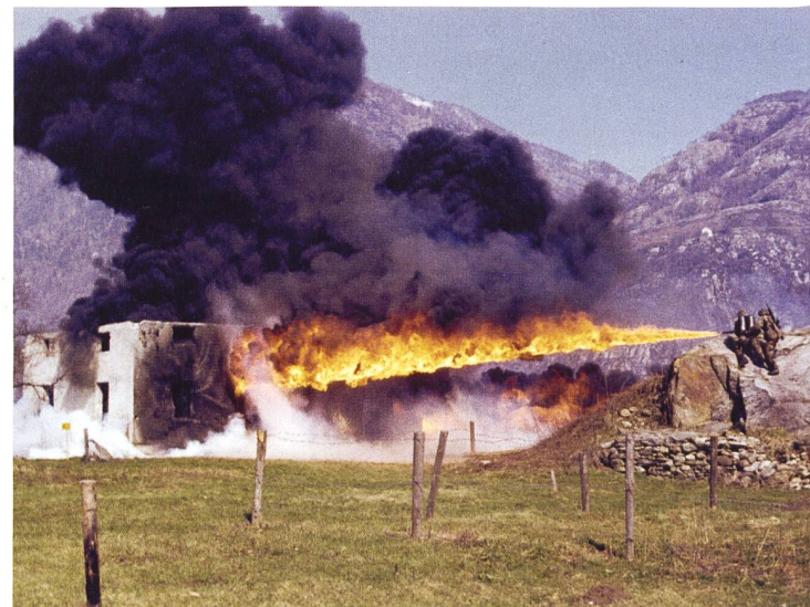
Grenadiere im Häuserkampf mit dem Flammenwerfer.