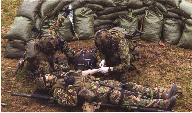
Sanitätsspezialist bei der Arbeit.