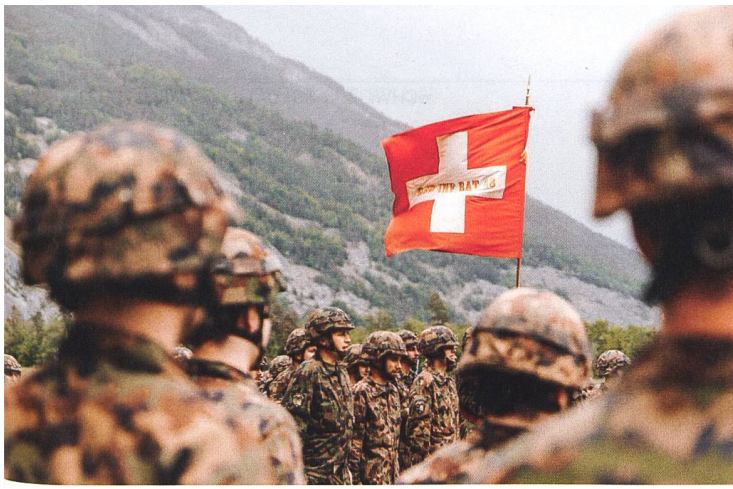
Dieses Jahr bildete das Geb Inf Bat 48 das militärische Hauptelement am Boden.