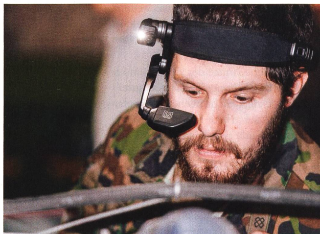
In einem Feldversuch überprüfte ein Team der Armee wie der Einsatz von Virtual Reality einen Mehrwert bei der Truppe und bei der Basislogistik schaffen kann.