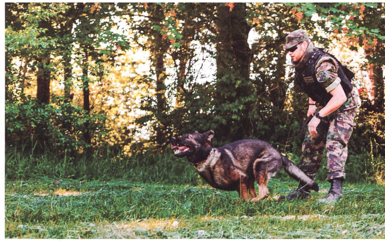
Das Geb Inf Bat 48 bereitete sich vorgängig auf den WEF Einsatz vor und profitiert dabei von der Verstärkung durch Militärpolizisten sowie Hundeführern.

In einem Punkt waren sich alle einig. Die Schweiz als Hort des Dialogs und internationalen Austauschs muss ihre Funktion als Konferenzstandort insbesondere auch in Zeiten der geopolitischen Konfrontation wahrnehmen können.