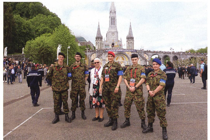
Ein Teil der Schweizer AdA waren im Ordnungs- und Sicherheitsdienst eingeteilt.