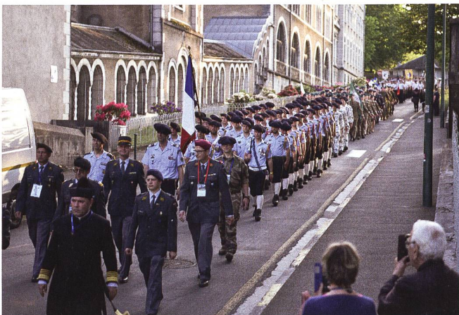
Die Schweizer Delegation führte den Marsch von rund 1000 Teilnehmern vom Zeltlager zur Basilika an.