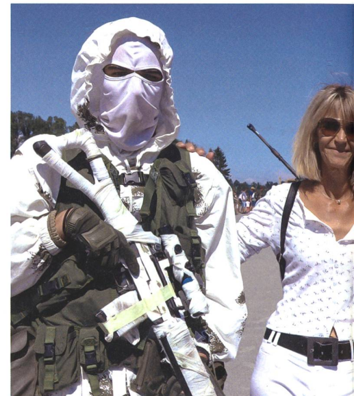
Auch die Infanterie war dabei! Hier im Foto