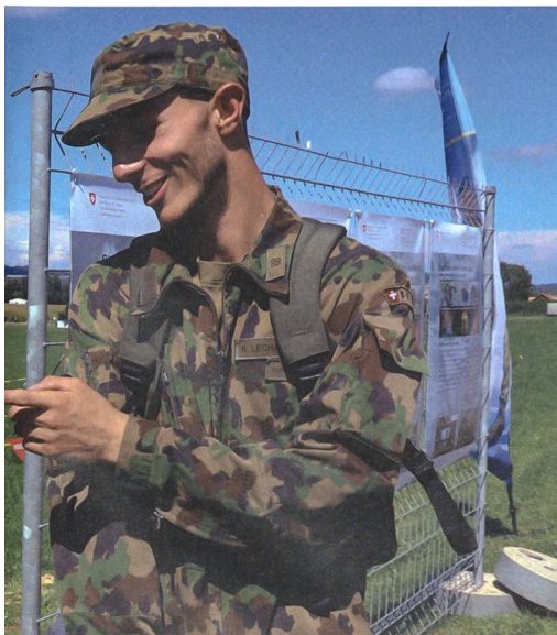
eine gute Gelegenheit, um als Rekrut die