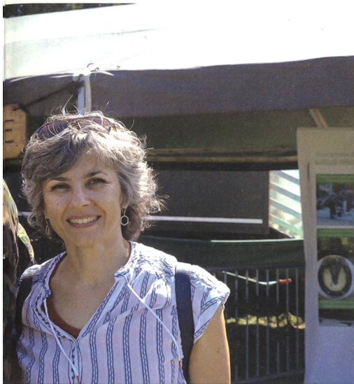
band Logistik, mit seiner Ehefrau.