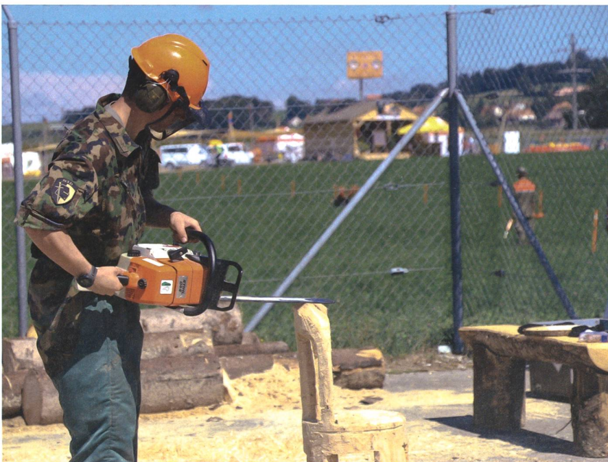
Fingerspitzengefühl: Ein Panzersappeur zeigt sein Können mit der Kettensäge.

Damit eine Milizarmee funktionieren kann, brauchen ihre Soldatinnen und Soldaten die Unterstützung ihrer Angehörigen. Sei das moralisch, oder wenn man auf das Haustier aufpasst. Am 50-Jahr-Jubiläum konnten die Rekruten ihren Familien einerseits ihre eigene Funktion und andererseits auch andere Teile der Armee präsentieren. Dies schaffte nicht nur Verständnis für den Einsatz der Söhne und Töchter, sondern auch eine Verbindung der Armee mit den Familien ihrer Truppe. +