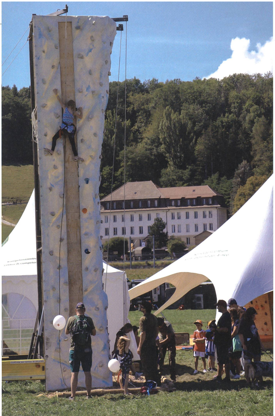
Wer hat das Zeug zum Gebirgsspezialisten?