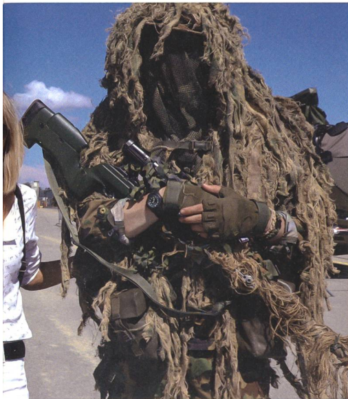
eine Besucherin mit zwei Spähern.