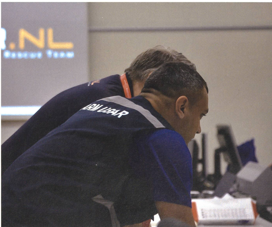
Die Übung förderte die Zusammenarbeit der verschiedenen Nationen.

Um die internationale Zusammenarbeit zu stärken und die eigenen Kompetenzen zu verbessern, wurden zudem Workshops durchgeführt.