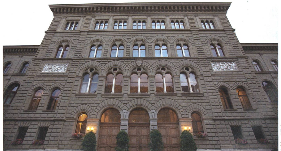
Der Bereich Verteidigung muss strategisch gestärkt werden. Im Bild: Bundeshaus OST, Sitz des Generalsekretariats VBS.