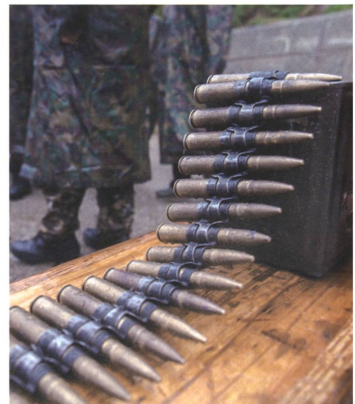
Keine Armee ist besser als ihre Munitionsvorräte!