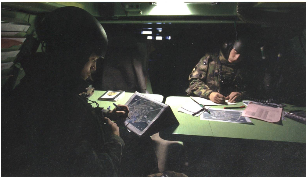
Telekommunikation: Die heutigen Systeme verfügen nicht über die notwendige Kapazität zur schnellen Übertragung digitaler Daten und sind nicht ausreichend integriert.