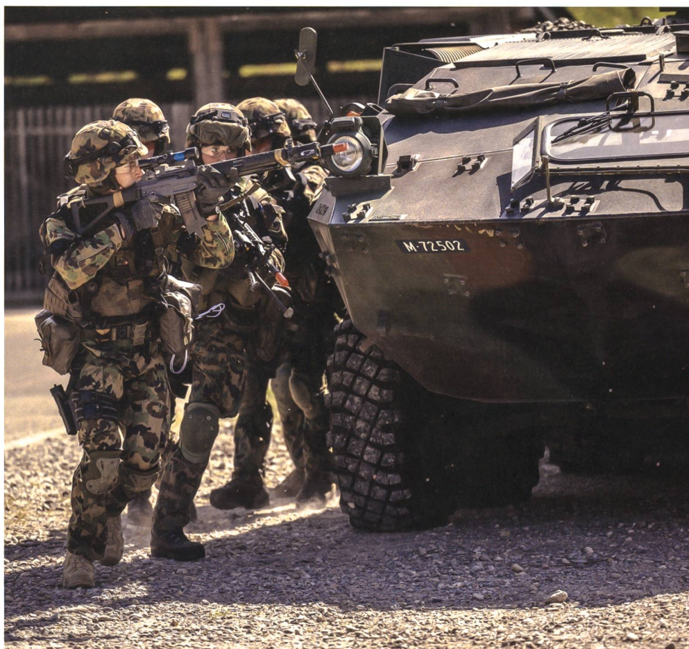
Es muss an Lösungen gearbeitet werden, um den Bestand mittelfristig auf die glaubwürdige Grösse von 250 000 Soldaten anzuheben.

Alle Systeme sind in ausreichender Anzahl zu beschaffen, das heisst mit Ersatzteil- und Datenpaketen («technische Gebrauchsanweisung») sowie Lebensendbevorratung. Minimal gilt die Formel: Bedarf +20% logistische Umlaufreserve +10% Degradationsfähigkeit (Abnutzung und Zerstörung) = 130%.