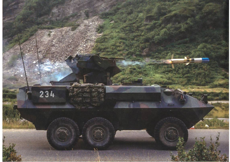
Durch die Ausserdienststellung des Panzerjäger 90 fehlt heute die Fähigkeit für weitreichende Panzerbekämpfung (bis 5000 Meter).