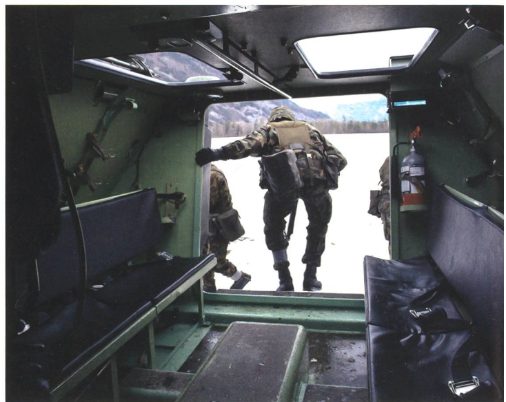
Heute erfolgt die Entlassung der Soldaten aus der Dienstpflicht bereits nach etwa zehn Jahren («Die besten Leute werden im besten Alter gekündigt»).