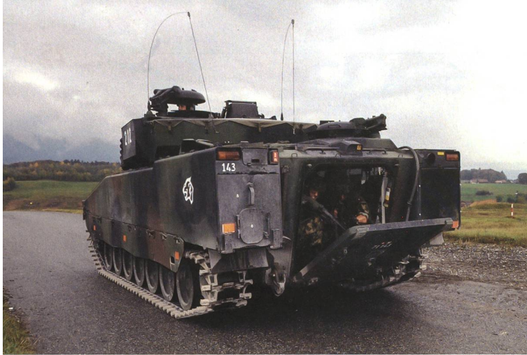
Heute fehlen kurzfristig 64 Schützenpanzer. Sämtliche bestehenden Systeme erfordern Investitionen (nebst der beschlossenen Nutzungsverlängerung auch eine Kampfwertsteigerung), um die Fähigkeiten zu erhalten.