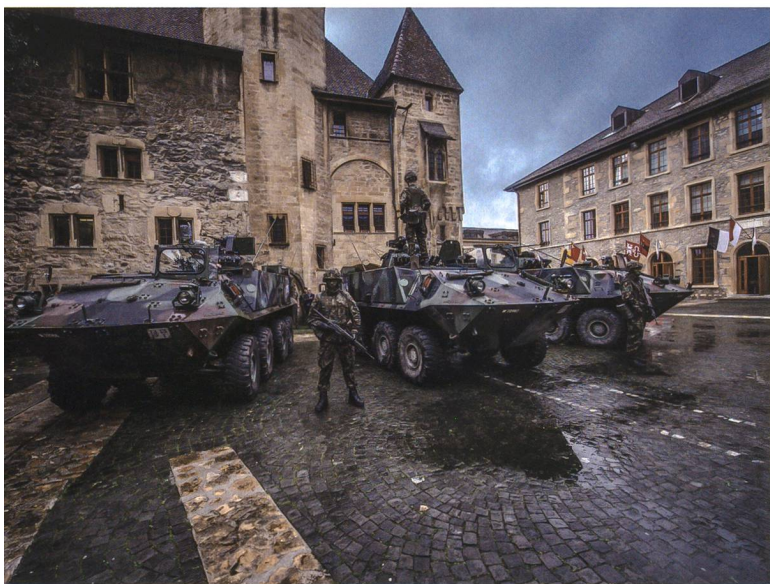
Die heutigen Personalbestände, 30000 Soldaten der vier Ter Div, sind mittelfristig auf total 75000 Soldaten auszubauen.