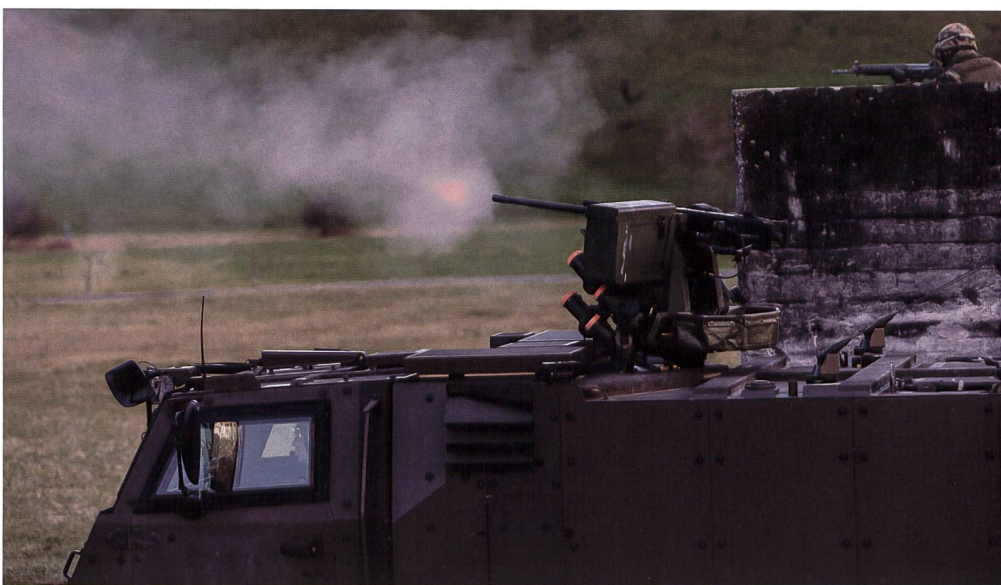
Feuerunterstützung durch das Bordgeschütz eines GMTF.