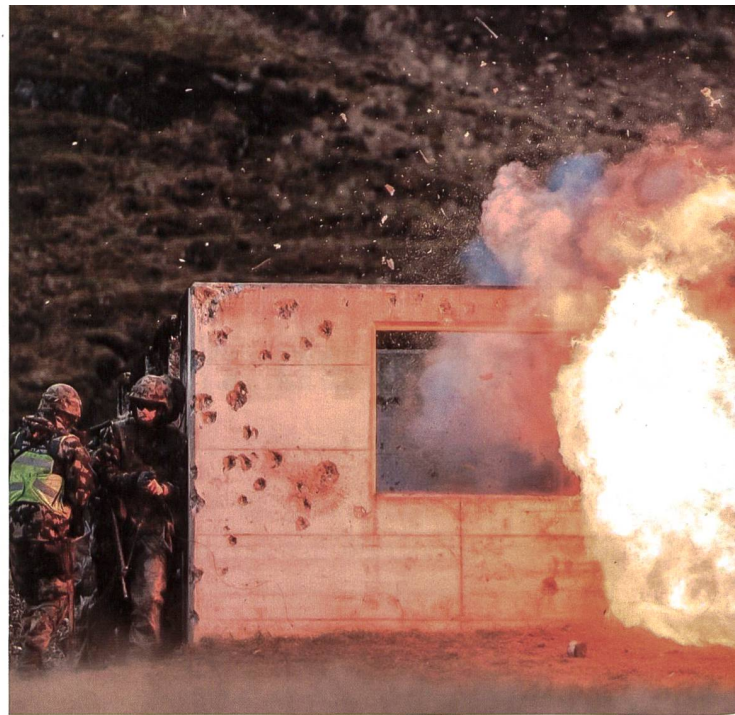
Das Kämpfen stand im Zentrum.