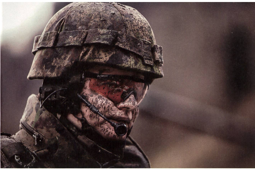
Mannschaft und Kader waren mit vollem Einsatz dabei.