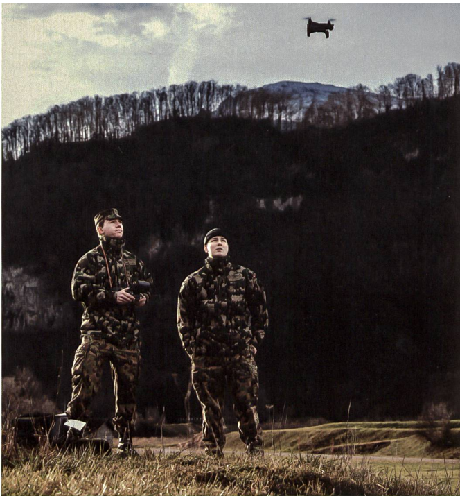
In der diesjährigen Dienstleistung wurden auch neue Mittel eingeführt.