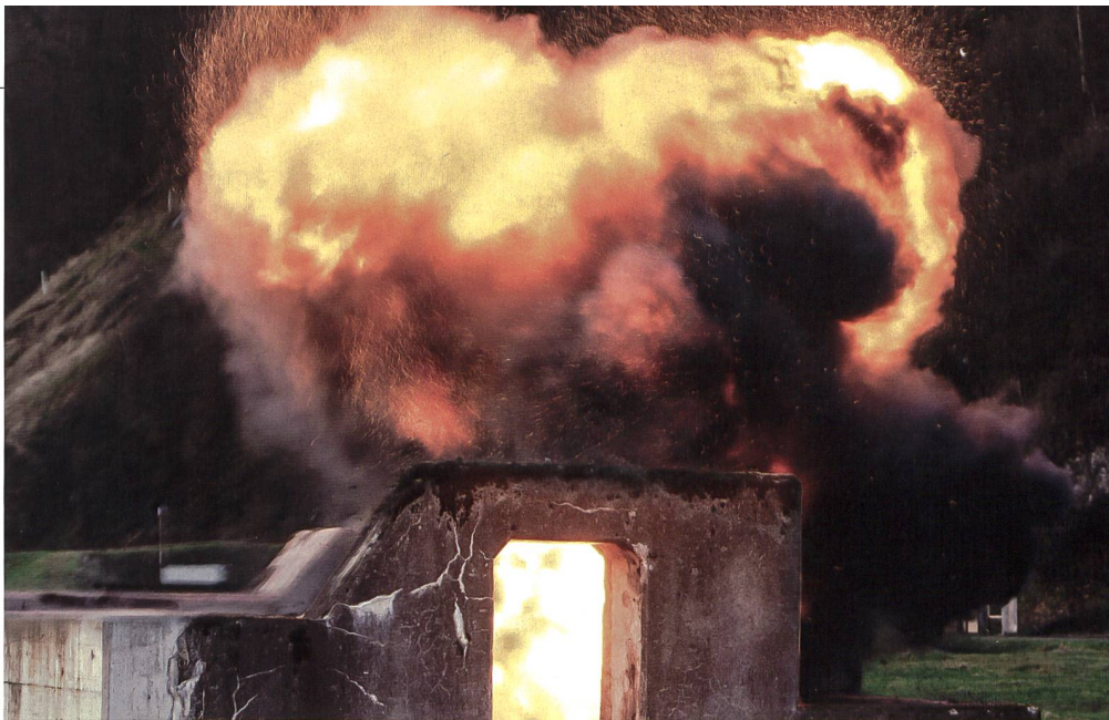
Detonation einer Sprengladung.

Bei der Unterstützungskompanie pflegten die Kanoniere das Minenwerfer-Handwerk. Stellungen wurden durch dicken Schnee gebuddelt, der Lader bereitete die Munition vor, der Richter justierte den 8.1