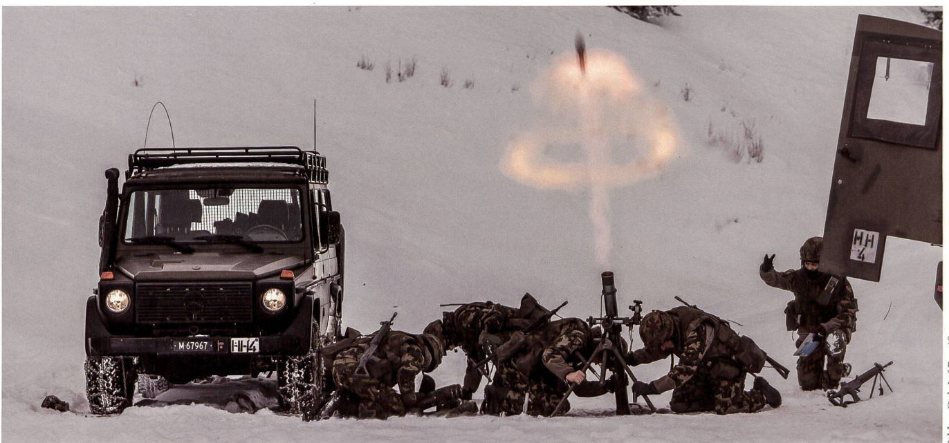
Feuer Frei! Die Minenwerfer der Unterstützungskompanie eröffnen das Feuer.

Das Gebirgsinfanteriebataillon 48 wurde seinem Namen diesen WK sicher mehr als gerecht und deckt neu wieder eine seiner Kernkompetenzen, die Grundfertigkeit, den Kampf im urbanen, bebauten und gekammerten Gelände zu führen, ab. +