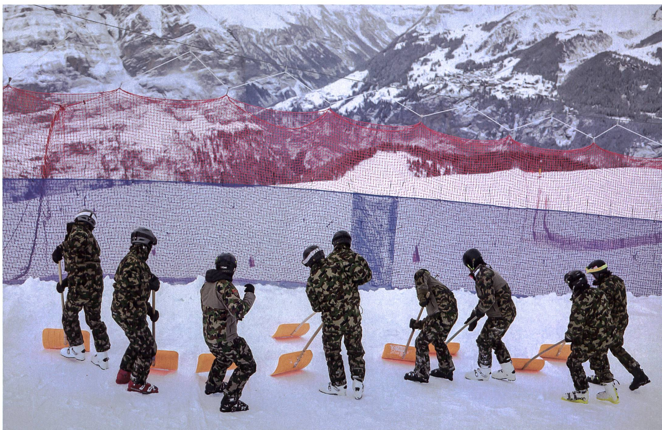
Pro: Das Rennen am Lauberhorn ist ein Anlass von nationaler Bedeutung mit definitiv internationaler Ausstrahlung (Symbolbild).

Um Ausbildungsdienstage zu sparen, lohnt es sich, andere Bereiche zu untersuchen. +