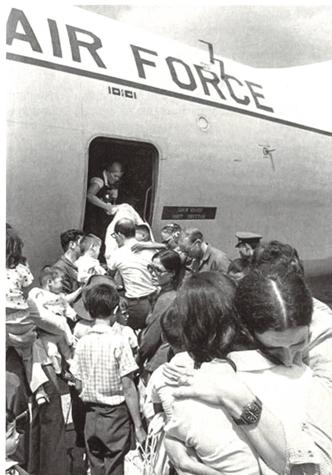
Südvietnamesische Flüchtlinge stürmen eine C-141 Starlifter-Maschine, um vom Luftstützpunkt Tan Son Nhut bei Saigon evakuiert zu werden. Kurz danach wurde der Luftstützpunkt gesperrt.

Die wichtigen Orte Quang Tri und Da Nang an der Küste fielen. Die Fluchtrouten südwärts waren abgeschnitten. Damit blieb den Tausenden von Flüchtenden nur der Weg über das Meer oder der Luftweg in den Süden.