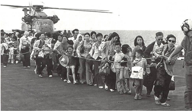
Zehntausende von flüchtenden Südvietnamesen wurden im Rahmen der Operation «Frequent Wind» am 29. und 30. April 1975 aus dem Grossraum Saigon auf Schiffe der 7. US-Flotte geflogen, hier mit CH-53-Helikoptern der Luftwaffe und des Marinecorps.

Am 30. April 1975 um 0900 war die bei misslichen Wetterverhältnissen erfolgte Operation «Frequent Wind» offiziell abgeschlossen.