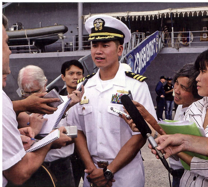
Commander Hung Ba Le, USN, Kommandant des US-Raketenzerstörers USS Lassen (DDG-82), wird anlässlich des ersten Besuchs eines US-Kriegsschiffes in Vietnam 2009 in Da Nang von neugierigen Einheimischen bedrängt und von Medienvertretern befragt.

Die Rolle hingegen jener unzähligen Personen (z.B. Jane Fonda, Jean Ziegler), jener politischen Bewegungen und Nichtregierungsorganisationen (z.B. der teils von der UdSSR und der Stasi finanzierten Weltfriedensrat), jener einseitigen Pazifisten-Gruppierungen oder all der «Friedensbewegten» im Westen, inklusive jener in der Schweiz, die sich jahrelang, teilweise bis heute, undifferenziert auf die Seite des kommunistischen Nordvietnams geschlagen haben und die diese schlimme Zeit nach 1975 kaum mit einer vergleichbar kritischen Haltung durchleuchtet haben, harrt bis heute einer ernsthaften Aufarbeitung. +