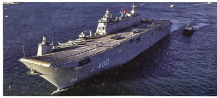
Erster Flugzeugträger für die Türkei.

Die Türkei hat am 10. April ihr bisher grösstes Kriegsschiff in Dienst gestellt. Mit einer Zeremonie auf der Sedef-Werft in Istanbul wurde der Helikopterträger TCG Anadolu offiziell in Dienst gestellt. Die TCG Anadolu soll dabei der erste Flugzeugträger der Welt sein, welcher ein Luftgeschwader beherbergt, das überwiegend aus unbemannten Flugzeugen (UAVs) besteht. Das Schiff, das nun zum türkischen Flaggschiff wird, soll über eine Deckkapazität für zehn Helikopter und elf UAVs sowie eine Hangarkapazität für 19 Helikopter und 30 UAVs verfügen. Bei der feierlichen Indienststellung der TCG Anadolu wurden auf dem Flugdeck neben vier Helikoptern eine bewaffnete Drohne Bayraktar Bay-