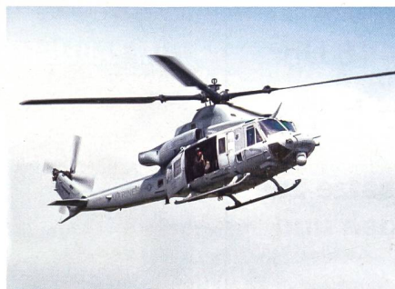
Versorgungshubschrauber UH-1Y Venom für die tschechische Luftwaffe.

Der erste AH-1Z für die Tschechische Republik absolvierte beim Bell Amarillo Assembly Center seinen Erstflug. Beschafft werden vier AH-1Z Viper und acht UH-1Y Venom. Die ersten Viper wurden im