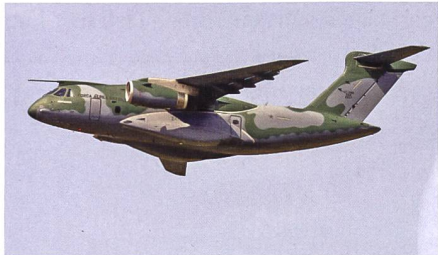
Taktisches Transportflugzeug Embraer C-390 Millennium.

Embraer und Saab arbeiten bereits beim Gripen-Programm eng zusammen; nun haben die beiden Luftfahrt- und Rüstungskonzerne eine Absichtserklärung bekannt gegeben, dass sie neben dem Gripen auch beim C-390-Millennium-Militärtransporter