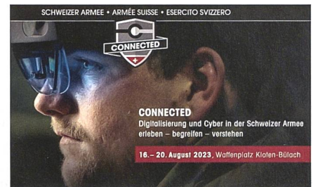
CONNECTED / Cyber