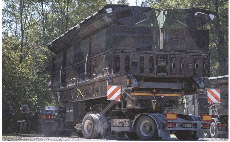
Brückenteile der Pontoniere werden mit Lastwagen zum Zielort transportiert.