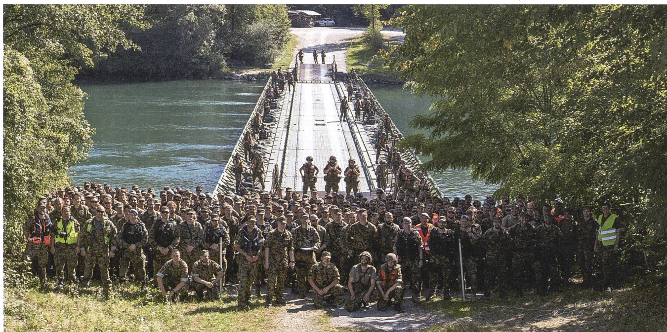
Die Übung war nicht nur dank der Auftrags Erfüllung ein voller Erfolg – jede und jeder konnte etwas lernen.

Auch wenn das Ziel – zugegeben, sehr knapp, aber erfüllt ist erfüllt – erreicht wurde, haben alle aus dieser Übung gelernt. Was denn genau? Bei der Schlussbespre-