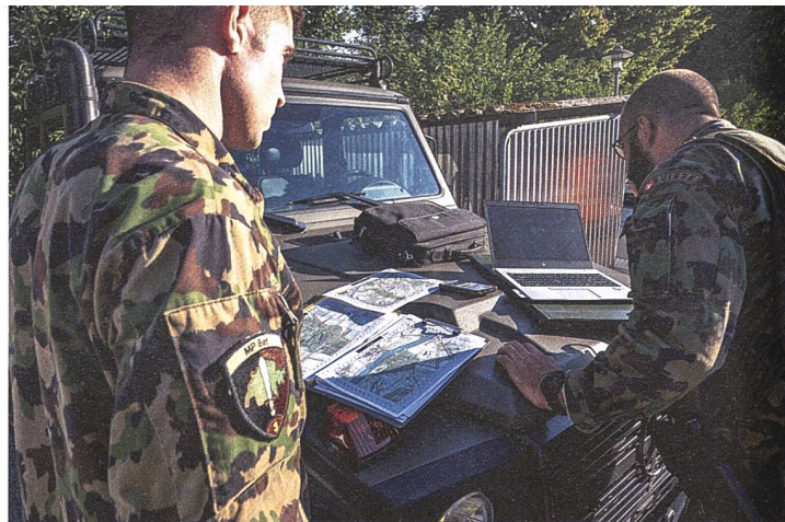
Die Motorhaube der G-Klasse muss im Eifer des Gefechts als Tisch ausreichen.