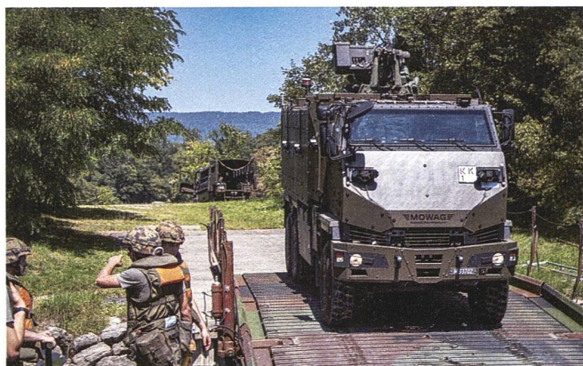
Die Schwimmbrücke hält einer Last von bis zu 70 Tonnen stand.