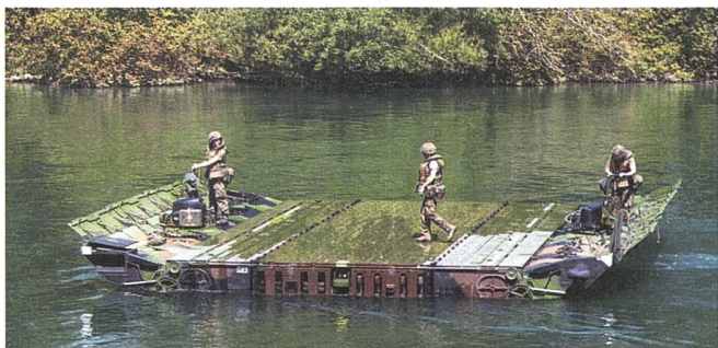
Sobald das Brückenteil im Wasser ist, manövrieren es die Soldaten zur Seite.