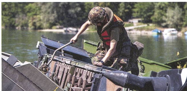
Die Pontoniere wissen genau, was sie tun.

chung sind sich Übungsleitung und Beübte schnell einig, denn es geht um die alten Grundsätze: Ein Auftrag, ein Raum, ein Chef. Führung geschieht von vorne und damit sie gelingen kann, braucht es unmissverständliche Kommunikation.