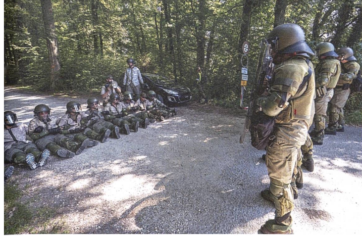
Bei 30 Grad Hitze war das Warten auf Verstärkung definitiv härter als gedacht.