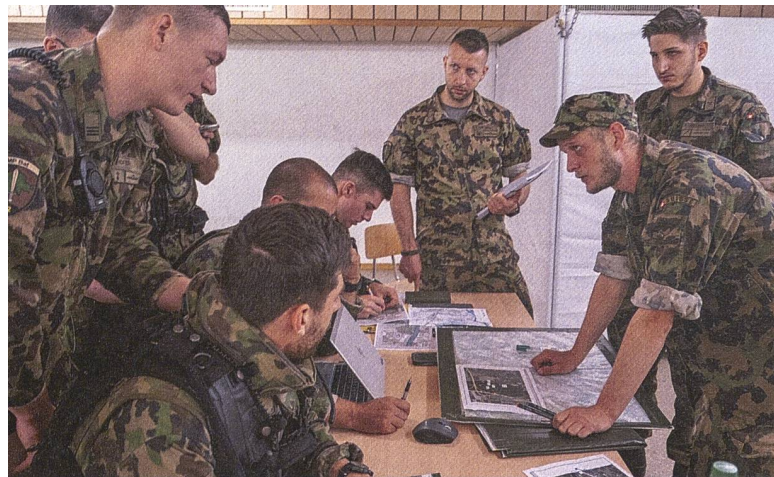
Die aufgeregten Kompaniekommandanten beim Absprachebericht um 7 Uhr morgens.