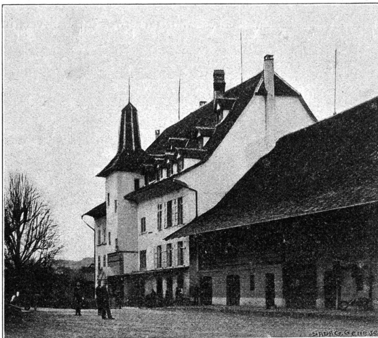
Hauptgebäude (mit Schulzimmern, Speisesaal usw.)

Um 1820 lebte in Bern ein reicher Herr, namens Dtth, der eine Tochter und einen Sohn hatte; der letztere war taubstumm von früher Kindheit an. Lange glaubten die Eltern, er sei taub geboren, es war aber nicht so. Eine Kindermagd hatte ihn einst auf den Boden fallen lassen, es aber der Herrschaft verheimlicht. Solchetraurige Kindermägde-Geschichten gibt es noch viel. Doch dieser Fall des Kindes mußte