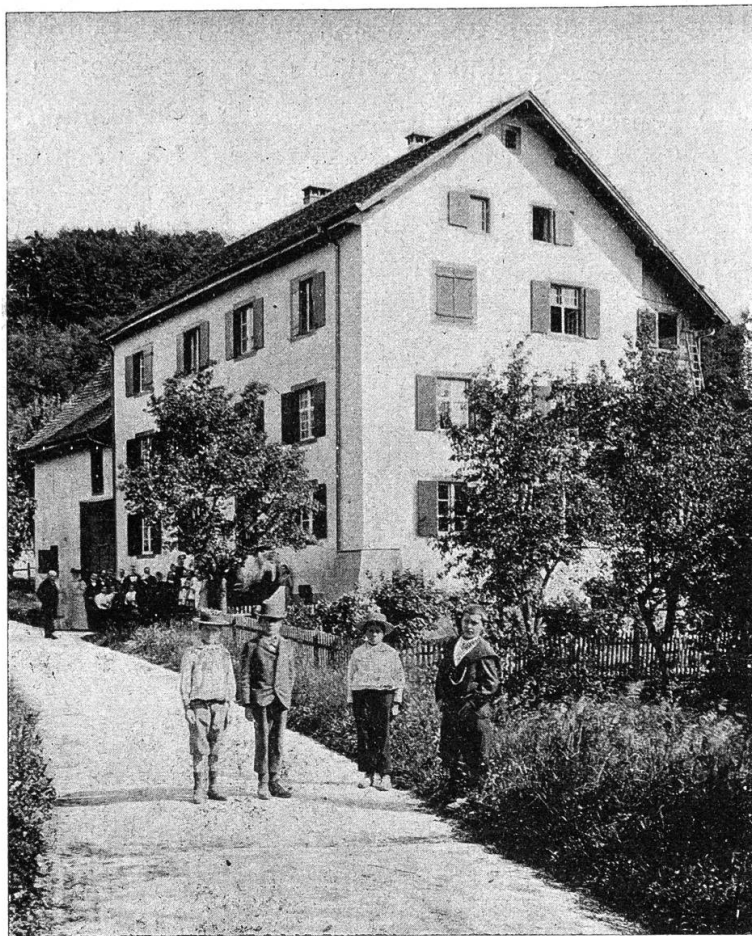
Taubstummenanstalt Niehen, Vorderseite.