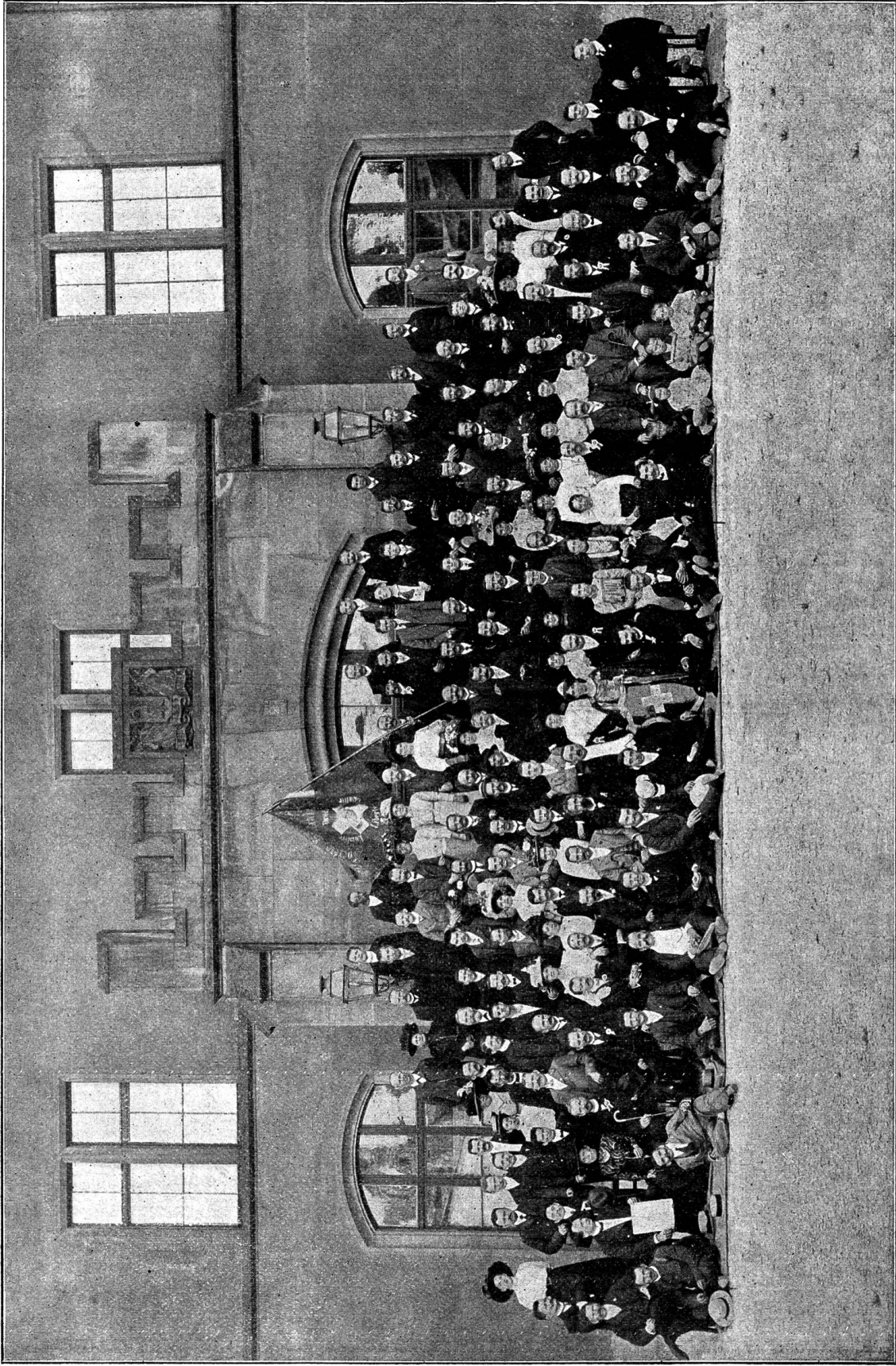
Die Teilnehmer am 10jährigen Stiftungsfest des Bader Sanftmännervereins.