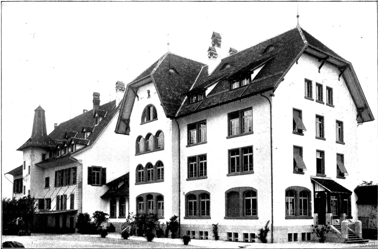
Vorderansicht der Taubstummenanstalt.

Rechts der Neubau, links das alte Gebäude, dessen inneren Umbau man hier natürlich nicht sehen kann.