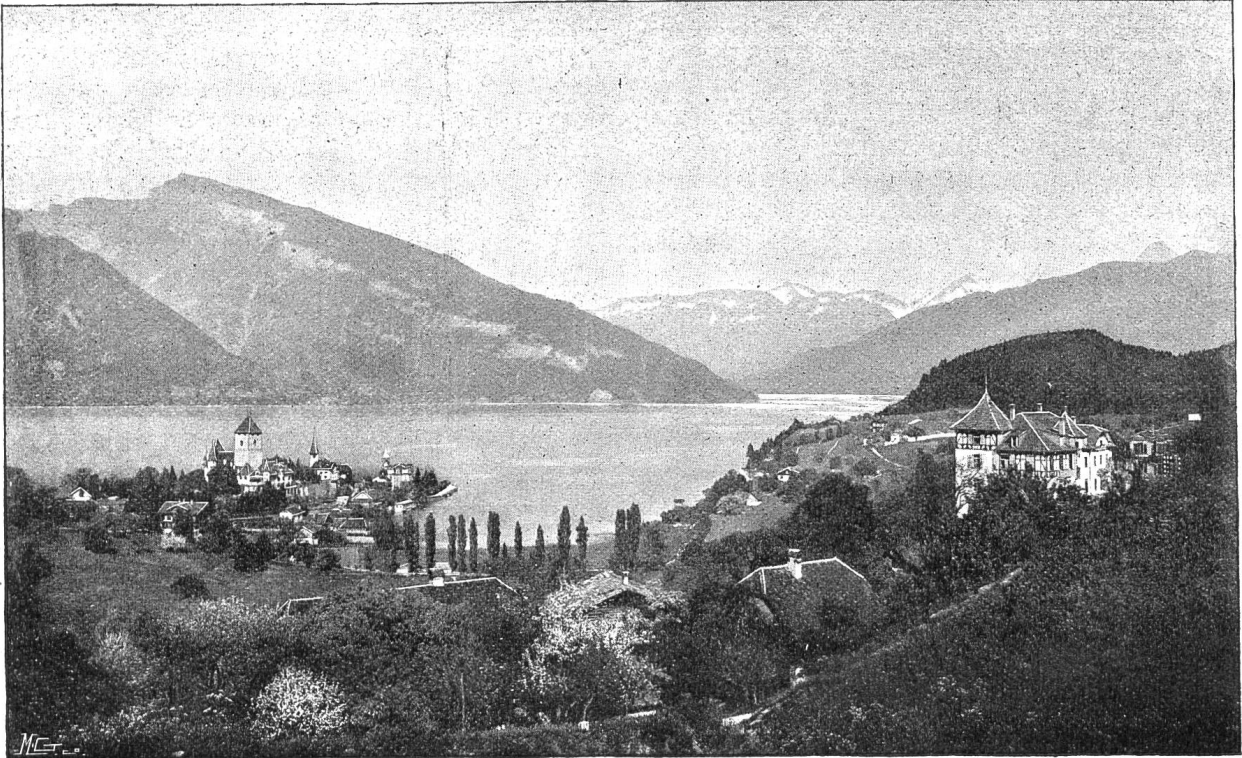
Der Thunersee mit Spiez (Kt. Bern).