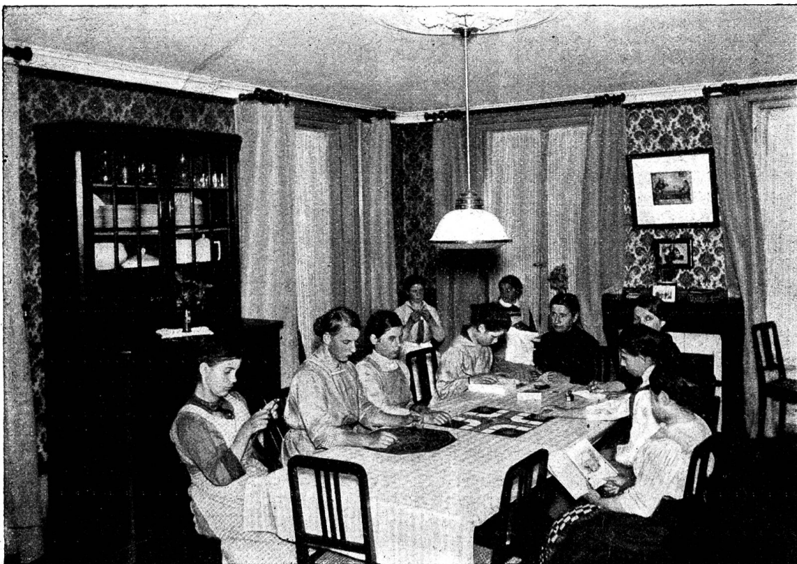
Ein Abend im Wohnzimmer.