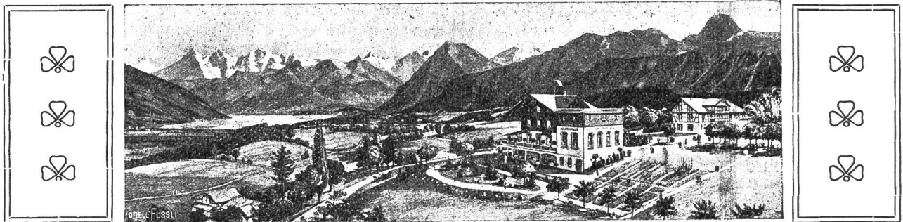
Taubstummheim Uetendorf: Gesamtansicht.