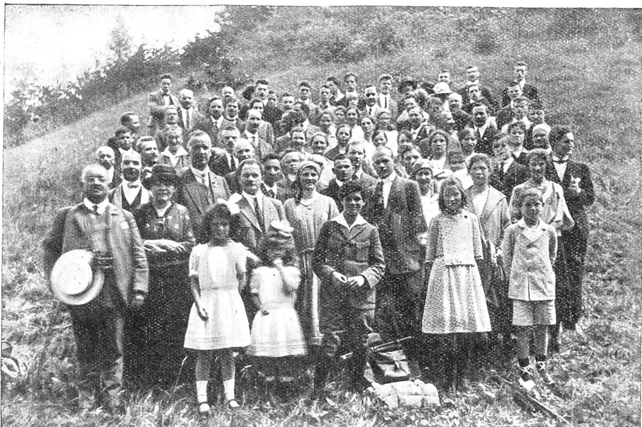
Mitglieder von den vier Taubstummenbunden Basel, Bern, Burgdorf und Biel.

Am 1. Juni auf der Petersinsel im Bielersee.