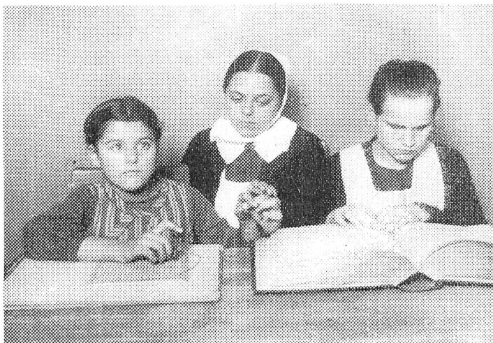
Schreib- und Lesunterricht der Taubstummblinden. Die Schwester buchstabiert durch Fingersprache dem Kinde einzelne Worte vor, welche es sich mit dem Blindenschreibgerät aufschreibt.

feierte, eine Abteilung für taubstummblinde Kinder angegliedert. 1912 konnte hier für diese Kinder ein besonderes Heim gegründet werden, das Raum für sechzig Zöglinge bietet. Die Methode, die dort bei dem mühsamen Unterricht angewendet wird und einzelne Momente aus dem Leben der Dreisinnigen veranschaulichen unsere Bilder. Nach kurzer Gewöhnung an das Anstaltsleben werden mit den Schülern Tastübungen vorgenommen, daneben buchstabiert man dem Kinde ein volles Wort im Fingeralphabet immer wieder in die Hand. Man reicht zum Beispiel den Ball zum wiederholten Betasten und buchstabiert dazu in die Hand des Kindes das Wort. Schließlich fingert das Kind das Wort selbst nach. Es weiß nun, daß mit den Fingerzeichen von „Ball“ der Gegenstand bezeichnet ist. Es wird nun bald die Bezeichnung anderer Gegenstände verlangen. Ist dieser stumme Unterricht einige Zeit fortgesetzt, so folgt der Unterricht im Sprechen. Das Bild zeigt uns, wie der Lehrer bei einem Schüler den Laut „a“ entwickelt. Der Schüler legt eine Hand an den Kehlkopf des Lehrers, die andere Hand an seinen Kehlkopf, fühlt so die Stimme des Lehrers und versucht sie nachzubilden. Daneben betastet er die Mundstellung des Lehrers und ahmt sie nach. Wenn ihm das nicht gut gelingt, so hilft der Lehrer mit Legung der Lippen in die rechte Stellung nach. Die Übung der Einzellaute nimmt natürlich viel Zeit in Anspruch. Sind