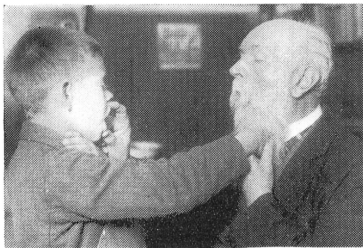
Das taubstummblinde Kind beim Sprachunterricht.

einige Laute geübt, so verbindet man sie zu Wörtern. Kann der Schüler kurze Sätze sprechen, so tritt ein einfacher Anschauungsunterricht ein, bei dem die Gegenstände betastet werden und die Lehrerin die betreffenden Sätze in die Hand der Schülerin buchstabiert, wie es das Bild darstellt. Der Unterricht ist überall Einzelunterricht, und jede Lehrerin kann nur vier bis fünf Kinder in ihrer Abteilung haben. In einem anderen Falle sehen wir eine Lehrerin mit zwei Schülerinnen, wovon die eine Blindenschrift liest und die andere nach Diktat der Lehrerin in die Hand etwas auf die Blindentafel schreibt. Diese Tafeln sind mit Killen versehen, über denen eine durchlöchernte Platte liegt, darunter legt man das Papier. Der Schüler tupft mit einem besonderen Stift in die Löcher, und auf dem Papier entstehen dadurch erhabene Punkte, die Brailleschrift. Bei einer freieren Unterhaltung kann man auch zu mehreren Kindern zu gleicher Zeit sprechen. In einer anderen Abteilung liest eine Lehrerin drei Kindern etwas vor, das die Kinder in der Mitte von Hand zu Hand weitergeben. Einzelne Kinder brachten es nach zehn- bis elfjährigem Unterricht dahin, daß mit ihnen Erzählungen gelesen werden konnten. Es sind natürlich nicht alle so weit zu fördern, da es für die meisten mehr auf die praktische Ausbildung ankommt. Die Zöglinge lernen Matten