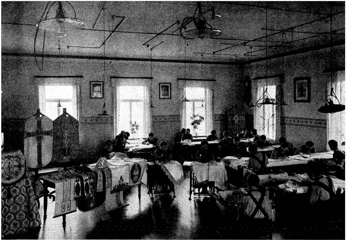
Taubstummenganstalt Zell in Mittelfranken (Bayern). — Arbeitsaal der Versorgungsanstalt für erwachsene Taubstumme.