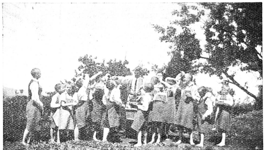
Bei der Kirschernte.