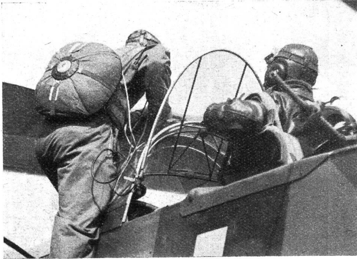
Pilot und Beobachter mit Fallschirmen.