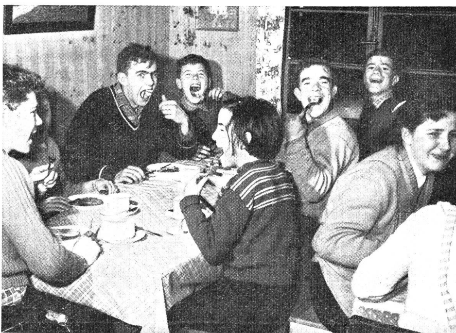
Die Kinder am Eßtisch treiben Schabernack mit dem Photographen.

Mit besonderer Genugtuung vernehmen wir auch, daß im Februar zum ersten Mal ein Skilager durchgeführt werden konnte.