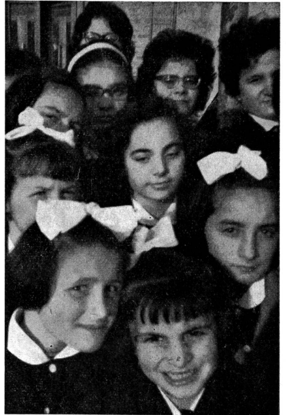
Taubstumme Schülerinnen erwarten den . . .