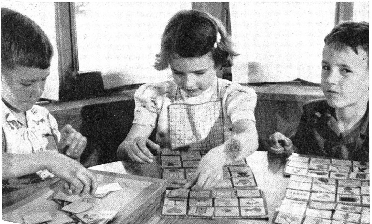
Im Kindergarten: Bilderlotto als Vorstufe für Sprachanbahnung

Der Kurzfilm möchte auf die Not der Einsamkeit, entstanden durch Gehörlosigkeit, hinweisen. Immer wieder wird diese Einsamkeit auf sehr feine und auch auf sehr lebensnahe Art in den Bildern zum Ausdruck gebracht. Der hörende Zuschauer kann nacherleben, wie «stumme» Musik auf den tauben Menschen einwirkt. Dann aber wird gezeigt, was Gehörlose und Hörende gemeinsam gegen den Feind Einsamkeit tun. Am Schicksal zweier taub-