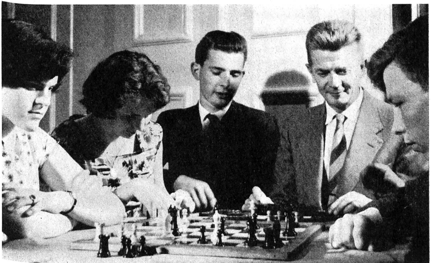
Taubheit isoliert — Gehörlosenvereine geben Gemeinschaft