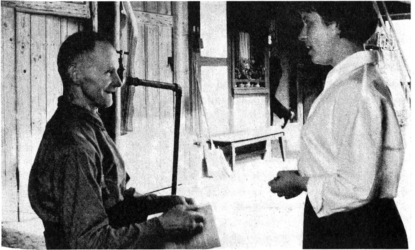
Die Fürsorgerin verbindet den Gehörlosen mit der hörenden Welt