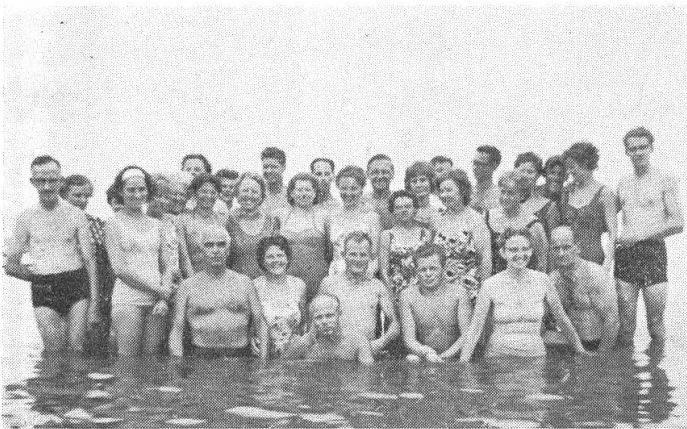
Bitte recht freundlich