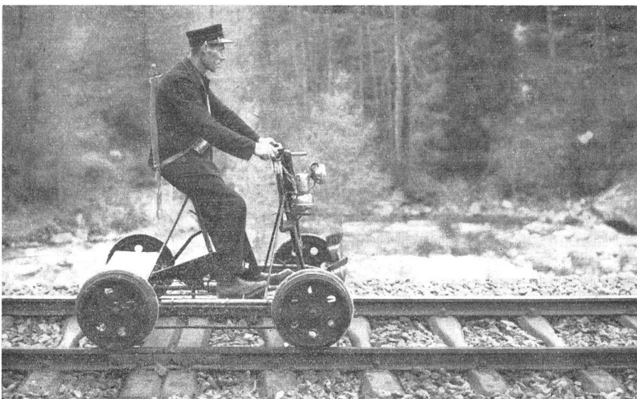
Eine Draisine erleichtert dem Streckenwärter zum Teil die Kontrollgänge.