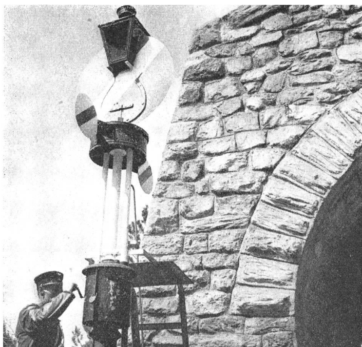
Die alten Signale müssen täglich von Hand aufgezogen werden.

dann lasse ich die betreffende Strecke sofort als gefährdet bezeichnen. Sie darf dann nur noch langsam befahren werden, bis die schadhafte Schiene ausgewechselt ist.»