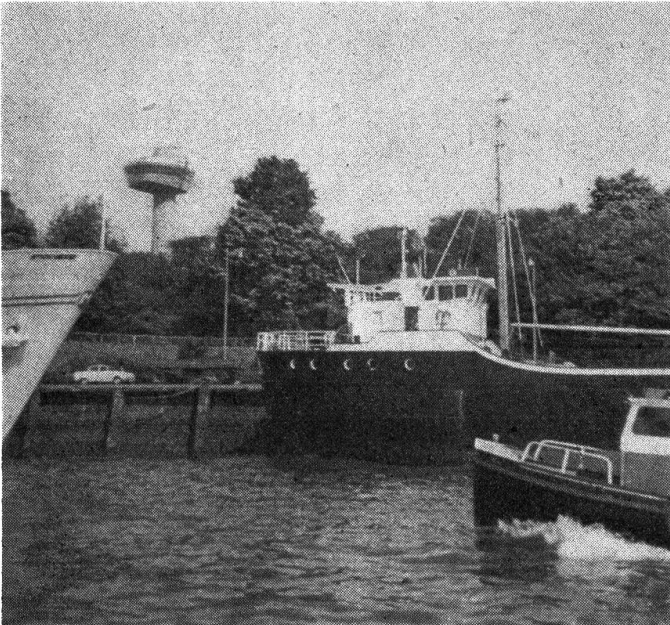
Der Hafen von Rotterdam mit dem Euromast

ist sehr groß und hat über 10 Stockwerke. Wir spazierten durch die Stadt und gingen zweimal in eine Bar. Wir beobachteten die Leute, welche viel Bier getrunken hatten. Viele Leute machten großen Lärm und Dummheiten. Auch stritten die Leute auf der Straße. Wir fuhren mit dem Taxi unter der Stadt zum «Rjinhotel». Um 1 Uhr in der Nacht gingen wir schlafen. Von unserem Zimmer konnte ich viele Lichter von der Stadt sehen. Ich schlief sehr gut. Das Telefon weckte uns am Morgen. Wir aßen um 8 Uhr das feine Morgenessen. Nach dem Essen gingen wir durch das Einkaufszentrum zum Hafen. Im Einkaufszentrum gab es keinen Autoverkehr. Die Straßen sind mit schönen Blumen, Bäumen und Vogelkäfigen mit Papageien geschmückt. Dann fuhren wir privat mit dem Motorboot durch den ganzen Hafen. Es brauchte zirka 3 Stunden. Es gab viele ausländische Meerschiffe. Diese bringen Handelswaren. Die Meerschiffe lagen auch auf dem Trockendock. Wir sahen auch große Schiffsschrauben. Wir fuhren nahe an die Meerschiffe heran. Der Schiffsbug ragte hoch über uns hinauf. Das Wasser im Hafen macht manchmal hohe Wellen. Unser Motorboot schwankte deswegen. Es war trotzdem schön. Wir sahen vom Hafen den hohen Euromast. Das ist ein sehr mo-