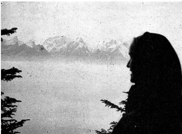
Über dem Nebel: die Savoyer Alpen.

Am Dienstag besprachen wir vormittags wieder Verschiedenes von der Expo. Es gab viel Neues zu lernen. Nachmittags wanderten wir durch die bunten Wälder und sammelten Blätter, die wir nachher pressen und auf die Lagerhefte kleben wollten. — Am Abend zeigte uns Fräulein Rollier Bilder aus dem Leben der Tuberkulose-Kranken in Leysin. Sie müssen viel liegen. Sie