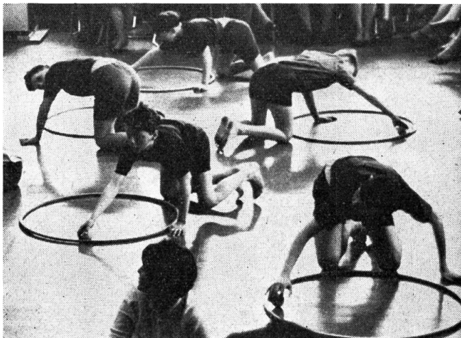
Bewegungsschulung mit Reif und Ball

Eine solche Hilfe ist die Rhythmik. In sorgfältig geplanten Übungen werden die Kinder angeleitet, sich freier und beherrscher zu bewegen. Wie man das macht, das muß aber gelernt werden.