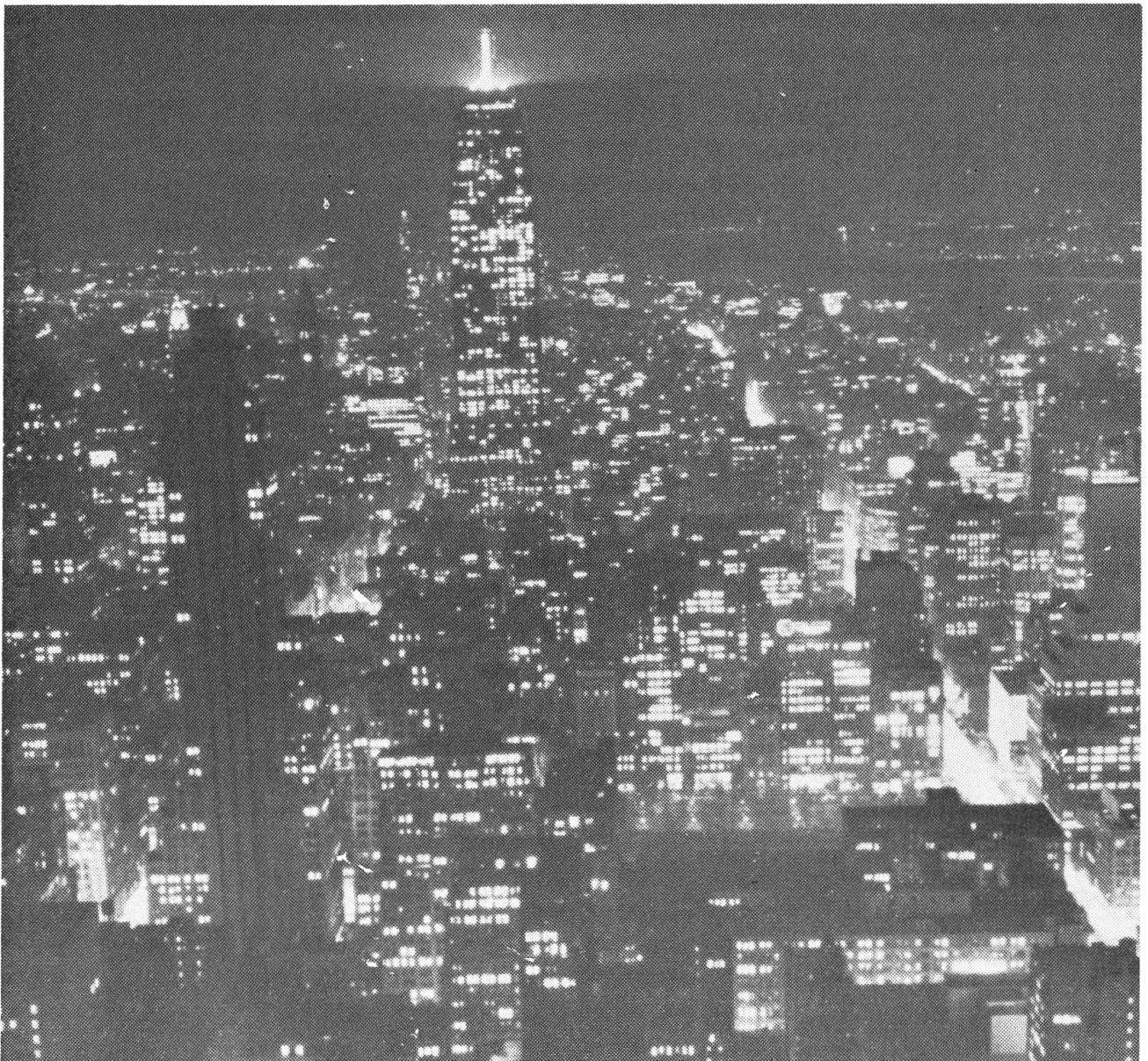
Das Lichtermeer Manhattans bei Nacht.

Der Straßenverkehr ist ruhig, viel weniger nervös als bei uns. Fahrräder, Motorroller, Fuhrwerke und Kleinautos fehlen. Die Autos mit automatischer Schaltung fahren leise. Überall gibt's rote und grüne Lichter. Die Fahrbahn ist breit. Wir fahren durch die Chinesenstadt: Inschriften, Zeitungen, Kinos zeigen die fremden Schriftzüge Chinas. Auch chinesische Schulen gibt's hier. — Unheimlicher wirkt Harlem: Hier sind 400 000 der insgesamt anderthalb Millionen Neger New Yorks beisammen. Große Teile dieser schwarzen Bevölkerung sind wenig geschult, viele auch arbeitslos. Besonders in der heißen