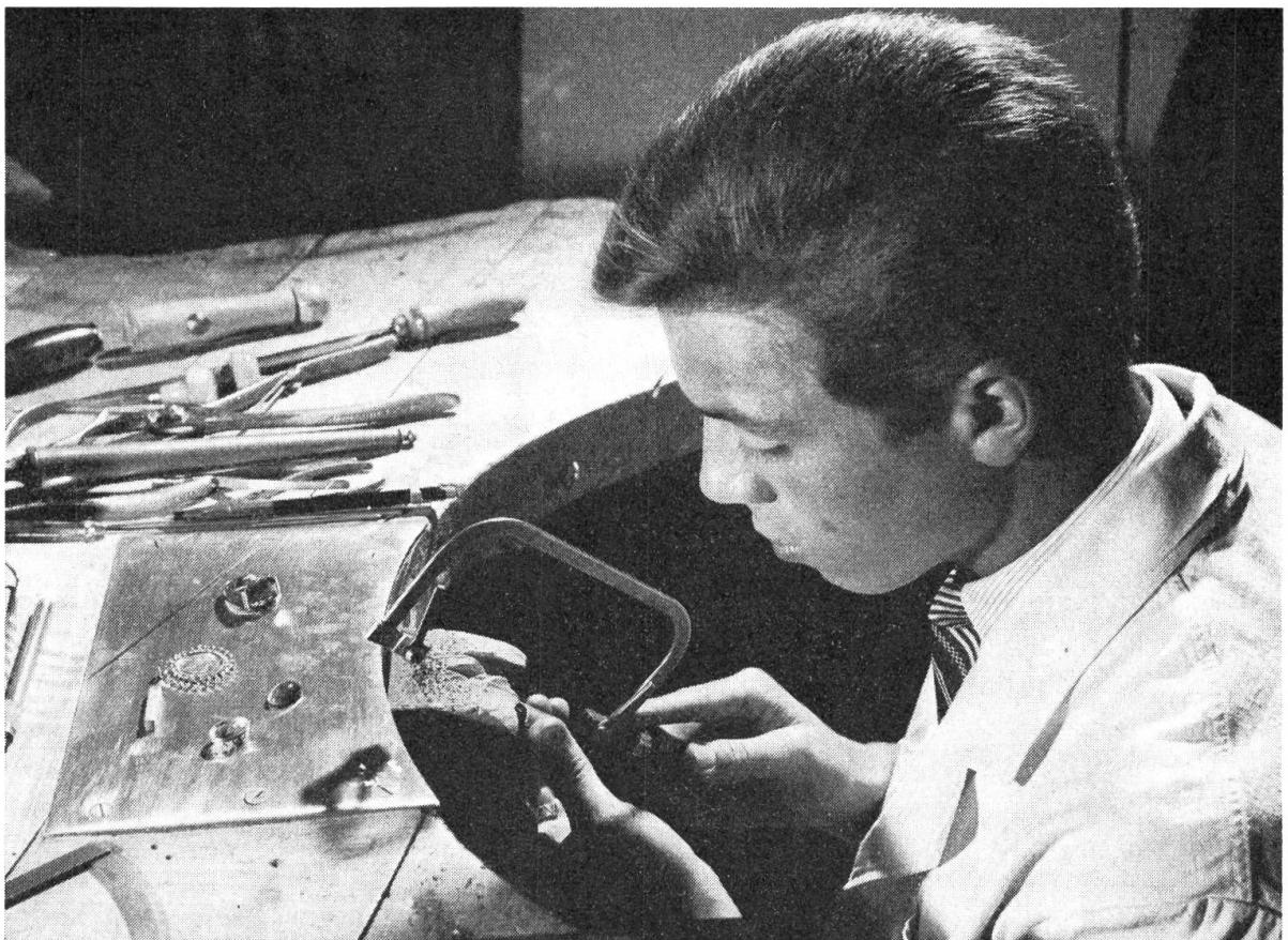
Goldschmied, ein altes Handwerk, das künstlerische Begabung und geschickte Hände erfordert.

Gegenwärtig gibt es in der ganzen Schweiz 5 haupt- und 14 nebenamtliche evangelische Taubstummenpfarrämter sowie 10 nebenamtliche Taubstummenprediger. Auf katholischer Seite wirken 19 nebenamtliche Taubstummen- und Gehörlosenseelsorger. — In beiden Konfessionen haben